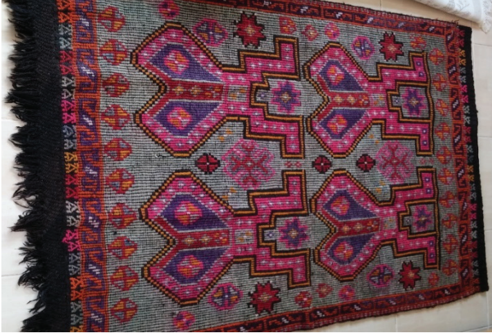
G. 13. Çul seccade ön yüzü (Emine Tonus, 2018)