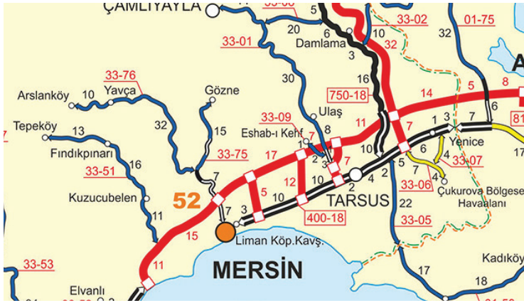
G. 1. Gözne Yaylası Haritası “Gözne harita KGM,” erişim 25 Nisan 2019, https://www.kgm.gov.tr/SiteCollectionImages/KGMimages/Haritalar/b5.jpg

İnsanlar ihtiyaçlarını karşılamak üzere doğada bulunan hammaddeleri el ile işleyerek çeşitli el sanatı ürünleri ortaya çıkarmışlardır. Bu ürünler, yaşanılan bölgeye, iklim ve bitki örtüsüne, örf ve âdetlerine göre şekillenerek, her yörenin kendi karakteristik özelliklerini meydana gelmiştir. “Türkler, Anadolu’da yerleşik düzene geçtikten sonra, günlük hayatlarının bir parçası hâline getirdikleri el sanatlarıyla yaşadıkları bölgenin özelliklerini harmanlayarak geleneksel, özgün ve tarihi eser niteliğinde ürünler meydana getirmişlerdir.” 1 Çeşitli sebeplerden dolayı kaybolmaya yüz tutan bu değerli el sanatlarımızdan biri de Mersin İli Gözne Yaylası’nda yapılan “ıstar dokumacılığı”dır. Konuyla ilgili daha önce bir akademik çalışma bulunmadığından unutulmaya yüz tutmuş bu dokuma tekniğini bilim dünyasına tanıtmaya çalışılmıştır.