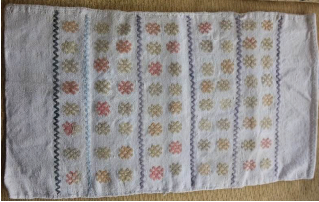
G. 4. Bulgur çuvalı ön yüzü (Emine Tonus, 2018)

Yöre dokumaları, gerek kompozisyon özelliği ve gerekse kullanılan motif karakterleri açısından birbirlerine çok benzemektedir. Motifler, eşkenar dörtgenlerin içine planlanabildiği gibi, yatay ve dikey kompozisyonla basit sıralı, almaşık veya vevet kullanılabilir. Yirmi örnek üzerinde yapılan araştırmada, “satranç, köşek tabanı, tabakalı zili, güllü, dilikli zili ve çingilli zili” isimleriyle bilinen dokumalar incelenmiştir.