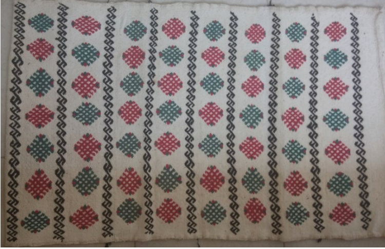
G. 15. Çuval ön yüzü (Emine Tonus, 2018)