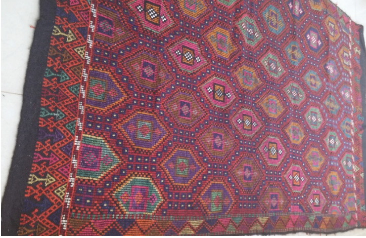
G. 17. Çul yaygı örneği (Emine Tonus, 2018)