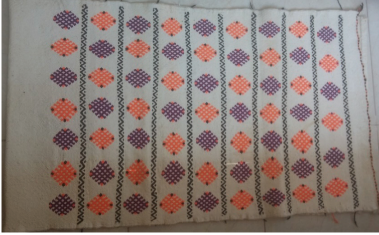
G. 14. Un çuvalı (Emine Tonus, 2018)