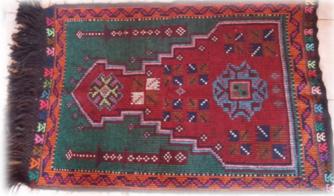
G. 24. Çul seccâde örneği (Emine Tonus, 2018)