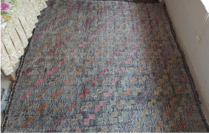
G. 7. Çul yaygı örneği (Emine Tonus, 2018)

düzende planlanmıştır. Ayrıca zeminde kullanılan düz dokumanın büyük bir bölümü kıllama denilen pamuk ve kıl karışımı iplikle dokunurken küçük bir bölümünde de sadece kıl tercih edilmiştir. Tek kanatlı satranç olarak tanımlanan motif, kare şeklindeki geometrik düzenin içine farklı renkteki başka bir iple verev noktalar konulmasından meydana gelmiştir. Yörede “dokumanın ayak motifi” ismiyle ifade edilen, yatay eksenindeki başlangıç ve bitiş noktalarındaki dar kenar sularında ise küpe motifleri kullanılmıştır.