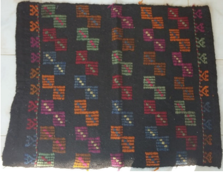
G. 22. Köşe çaputu örneği (Emine Tonus, 2018)