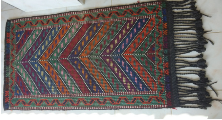
G. 21. Çul seccâde örneği (Emine Tonus, 2018)