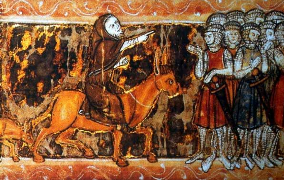
Resim 2: Pierre L'Ermite, Haçlılara yol gösteriyor. 103