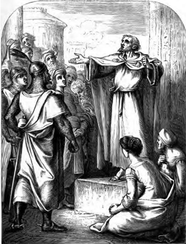
Resim 1: Pierre L'Ermite, Haçlı seferini vaaz ediyor. 102