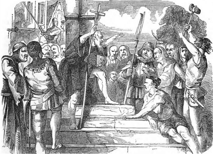
Resim 3: Pierre L'Ermite, Haçlı seferini vaaz ediyor. 104