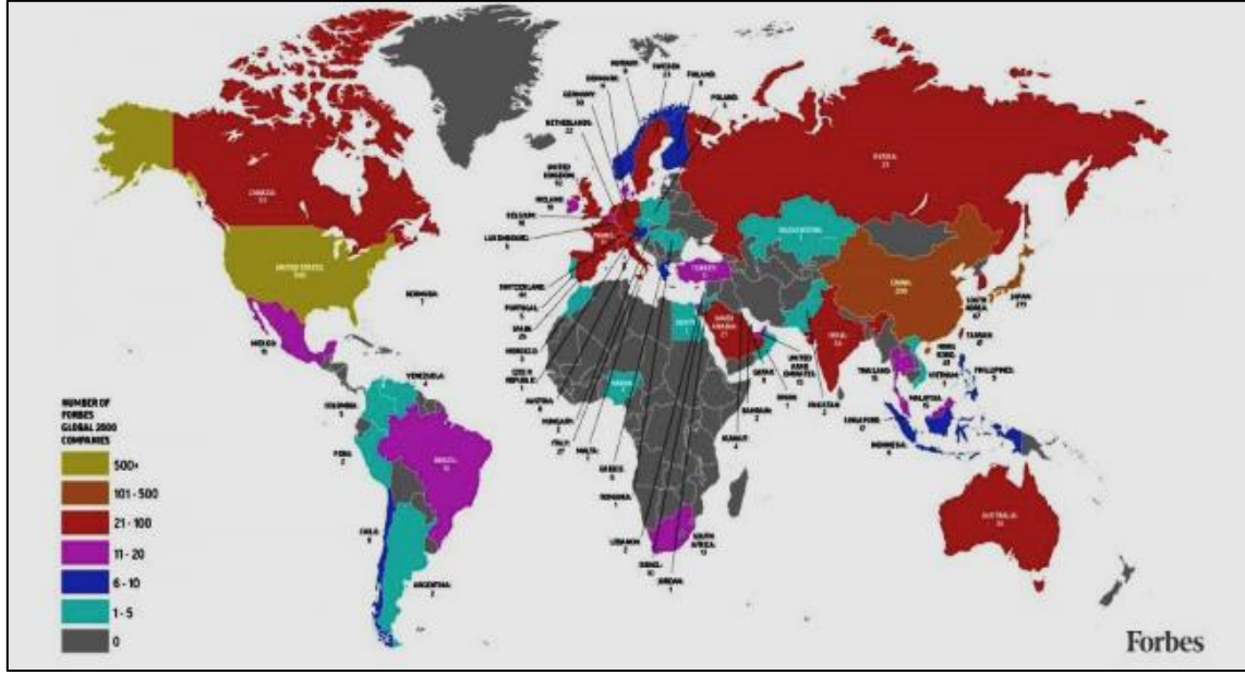
Şekil 3 – Dünyada ÇUŞ'lerin Ülkelere Göre Dağılımı (2016)

Dünyada ÇUŞ'lerin ülkelere göre dağılımında 2016 yılında ABD'de 540 çok uluslu şirket bulunmaktadır. Çin 200, Birleşik Krallık 92, Kanada 53, Almanya 50 ve Türkiye ise 11 çok uluslu şirkete sahiptir. Haritada gösterildiği gibi ABD dünyada 500'den fazla çok uluslu şirkete sahip olan bir ülkedir ve Çin ise çok uluslu şirket sayısı 101-500 arasında olan grupta yer almaktadır. Afrika kıtasının dört ülkesi dışında (Mısır, Fas ve Nijerya 1-5 arası grupta ile Güney Afrika 11-20 arası grupta) geri kalan bölgelerin tamamının çok uluslu şirket sahibi olmadığı görülmektedir. Ülkelerde ÇUŞ sayısı çok olsa da toplam gelir açısından bu şirketlerin ilk sıralarda yer almadığı görülmektedir. Bu yüzden aşağıdaki tabloda küreselleşme sürecinde dünyada en çok gelir elde eden şirketler sıralaması değişimleri gösterilmiştir (Fortune 500).