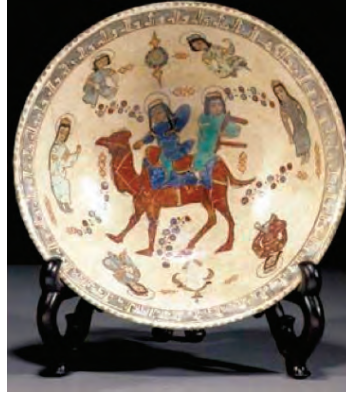
Resim 26. Selçuklu dönemi seramik kâse - XII-XIII. yy. - İran