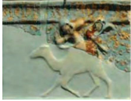
Resim 29 ve Resim 30. Selçuklu mimari dekorasyon öğeleri- XII-XIII. y. -İran- Louvre Museum