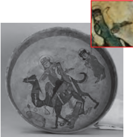
Resim 19. Selçuklu dönemi seramik kâse XII-XIII yy. Keşan/İran - Minai tekniği Brooklyn Museum