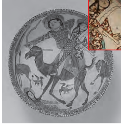
Resim 24. Selçuklu dönemi seramik kâse XII-XIII. yy. Kaşhan/İran – Minai tekniği The Metropolitan Museum of Art