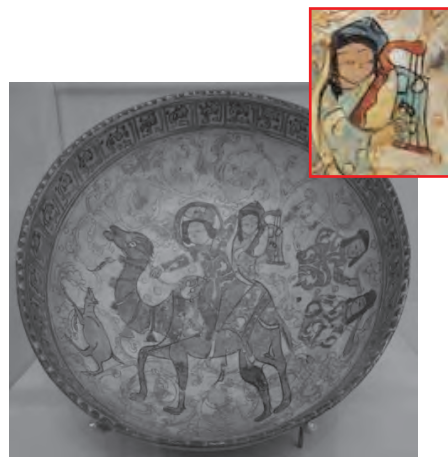
Resim 20. Selçuklu dönemi altın yaldızlı seramik kâse - XII-XIII. yy. Keşan/İran Güney Avustralya Sanat Galerisi