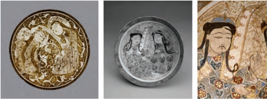
Resim 9. (solda) Selçuklu dönemi seramik tabak - XII-XIII. yy. Kaşhan/İran – Lüster tekniği - Dar al-Athar al-İlamiyyah – Kuveyt - http://darmuseum.org.kw ;

Hükümdarın görevlileri arasında çeng çalan kadın müzisyen, Selçuklu saray müzisyenleri, bu görevliler içinde kadınların yer alması ve çeng çalgısının Selçuklu saraylarındaki varlığına ilişkin bilgiler edinmemizi sağlamaktadır. Figür, Türk tarzı bağdaş kuruşu ve yine Türk tipi kaftanı ile görülmektedir. Oturarak icra ettiği sazi, yine açık ve köşeli bir tipe sahiptir. Çeng, hükümdarın ya da saray mensubu diğer kişilerin etrafında, eğlence sahnelerinde resmedildiği gibi, aşk sahnelerinde de yer almaktadır.