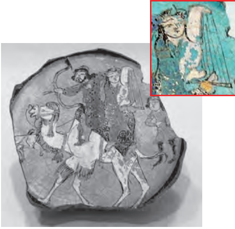
Resim 17. Selçuklu dönemi seramik tabak - XIII. yy. - İran Pergamon Museum - Berlin