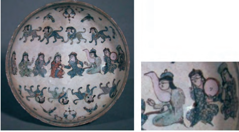
Resim 7. Selçuklu dönemi seramik kâse XIII.yy. – Rey/İran - Minai tekniği - Freer Gallery of Art - Washington.

Resim 7’de 19 orta sıranın ortasında görülen kadın ve erkek saraylının yanında, farklı desenli kaftanlı çalgıcılar, onların altında ve üstünde ise sıra halinde, saraya uğur getirdiğine inanılan, koruyucu dörder sfenks figürü tasvir edilmiştir. Saraylı çiftin hemen sağında görülen üç müzisyenin içinde çeng çalan bir figür yer almaktadır. Bu seramik eserde, İbn Bîbî’nin de Anadolu Selçuklularından söz ederken anlattığı, Selçuklu saray eğlenceleri, düğünler ve av şölenlerinde yer alan saray çalgıcılarının bir benzeri canlandırılmıştır 20 . Çok değerli bir sanat tarihi uzmanı olan Öney, bu kompozisyonda yer alan müzisyenleri “tanbur, lir, flüt çalan kişiler” olarak tanımlamıştır. Bu açıklama muhtemelen müze kataloğundaki tanımın birebir çevirisi olmalıdır. Batılı kaynaklarda çeng yerine lir; tef/davul yerine tanburin; ney yerine flüt denildiğine sık şahit olmaktayız. Burada da böyle bir isimlendirme hatası mevcut olmalı. Merkezde yer alan saraylı çiftin sağında, köşeli, açık arp sınıfına dâhil olan çeng, yanında tef, onun yanında da üflemeli bir çalgı (muhtemelen ney) çalan müzisyen figürleri yer almaktadır. Büyük Selçuklu seramiklerinde çeng, hükümdarın etrafındaki müzikli eğlenceler de görüldüğü gibi, saray görevlilerinin resmedildiği seramik eserlerde de hükümdarın etrafında yer alabilmektedir. Müze kataloğunda “Hükümdar ve Görevlileri” olarak kaydedilmiş olan aşağıdaki eser, buna örnektir.