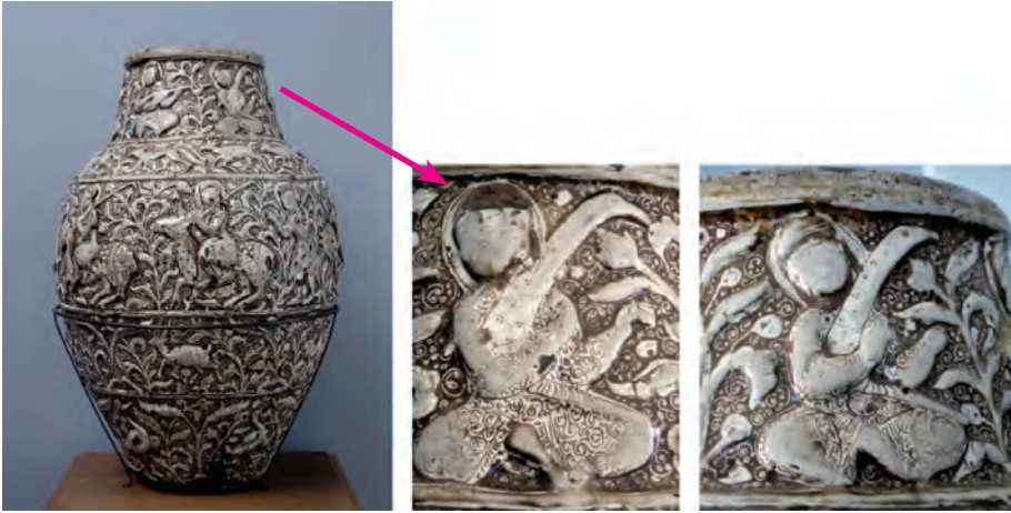
Resim Grubu 14. Selçuklu dönemi seramik vazo ve detaylar - XIII. yy. - Yükseklik: 80 cm. - İran Lüster tekniği - Hermitage Museum (Collection of A.P. Basilewski) – St. Petersburg