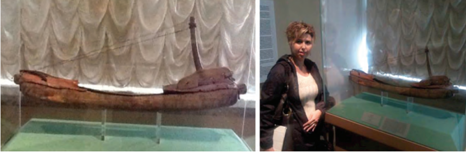
Resim Grubu 2. Hun Arpa/Çengi M.Ö. IV-V. yy. - Hermitage Museum - St.Petersburg 2012.

Devam eden dönemlerde de Türklerin arp benzeri çalgılarla olan yakınlıkları takip edilebilmektedir. Özellikle Turfan Bölgesi'nde kurulan Uygur Devleti döneminde, duvar resimleri, freskler ve minyatürlerde bu çalgıyı görmek mümkündür. Uygur arpları, daha sonraki İlhanlı ve Timurlu arplarına temel teşkil etmiştir 11 . Altta solda Selçuklu dönemi çengleri ile paralellik gösteren açık ve köşeli tipte bir Uygur arpa; sağda ise bir koltuk arpa görülmektedir.