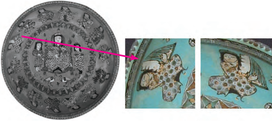
Resim 8. Selçuklu dönemi seramik kâse ve detay XII-XIII.yy. - İran - Minai tekniği The Metropolitan Museum of Art - New York.

Hükümdarın görevlileri arasında çeng çalan kadın müzisyen, Selçuklu saray müzisyenleri, bu görevliler içinde kadınların yer alması ve çeng çalgısının Selçuklu saraylarındaki varlığına ilişkin bilgiler edinmemizi sağlamaktadır. Figür, Türk tarzı bağdaş kuruşu ve yine Türk tipi kaftanı ile görülmektedir. Oturarak icra ettiği sazi, yine açık ve köşeli bir tipe sahiptir. Çeng, hükümdarın ya da saray mensubu diğer kişilerin etrafında, eğlence sahnelerinde resmedildiği gibi, aşk sahnelerinde de yer almaktadır.