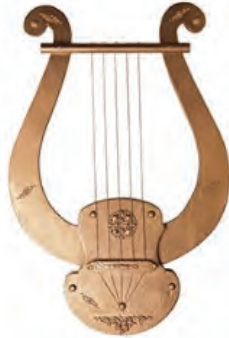
Resim 28. Lir

Çeng gibi arp ailesinden olan lir, eski Yunan'dan Mezopotamya'ya, Mısır'dan Anadolu medeniyetlerine uzanan geniş bir kullanım sahasına sahiptir. Çalgı, çerçevli arp sınıfına dâhildir.