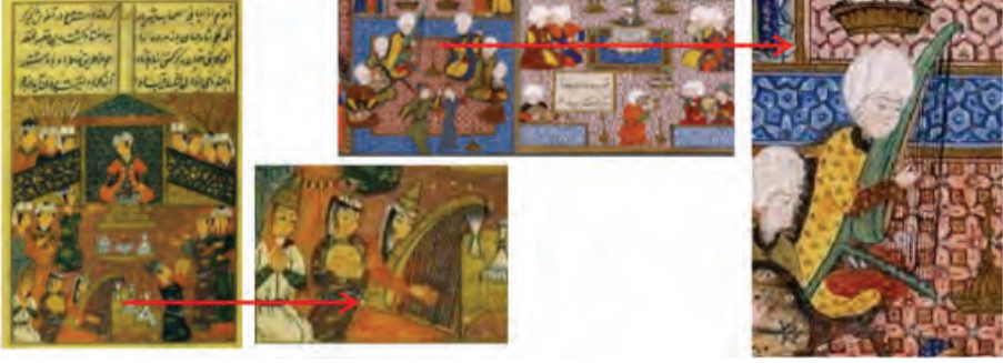
Resim Grubu 5. (solda) Fatih dönemi minyatüründen detay (XV. yüzyıl) – (Ş. Beşiroğlu ve G. Koçhan); (sağda) Kanuni dönemi minyatüründen detay – Süleymanname (XVI. yüzyıl).

dır 18 . Bu makalenin temel konusu Selçuklu çengleri olduğu için burada bu kadar bilgi sunmakla yetinilecektir.