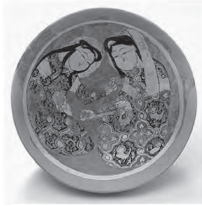
Resim 13. Selçuklu dönemi seramik kâse XII-XIII. yy. Kaşhan/İran Miho Museum http://www.miho.or.jp/english/