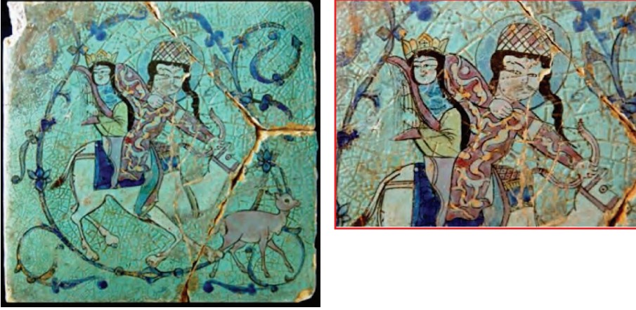
Resim Grubu 33. Selçuklu dönemi kare çini 1236 Kubadabad Sarayı - Konya Koyunoğlu Müzesi - Konya

Kubadabad Sarayı kazılarında en çok karşılaşılan buluntu gruplarından birisi seramikler ve çinilerdir. Sıraltına uygulanan ve çinilerle benzer teknik, malzeme ve süsleme özellikleri gösteren bu seramikler, çok sayıda küçük kırıklar ve az sayıda tam formlu buluntulardan oluşur 33 . Örneklerde yer alan parçalar, Büyük Selçuklulardan gelen kültürün devamlılığının güzel bir örneğidir. Buradaki en dikkat çekici farklılık, binek hayvanının daha değişik çizilmiş olmasıdır. Bu da coğrafi farktan kaynaklanıyor olmalıdır.