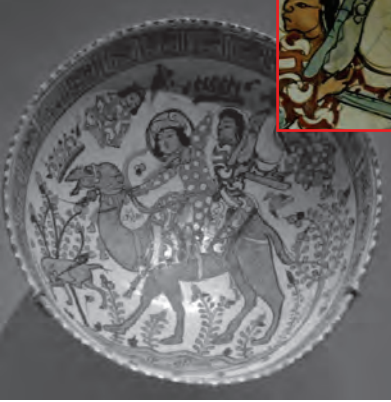
Resim 23. Selçuklu dönemi seramik kâse XII-XIII. yy. - İran - Minai tekniği The Metropolitan Museum of Art