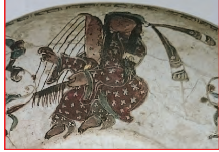
Resim Grubu 34. Selçuklu dönemi kase – Minai tekniği XII-XIII. yüzyıl – Kaşkan (?) - Louvre Museum 36

Büyük Selçuklular ve Anadolu Selçuklularını takiben Osmanlılar döneminde de çengin XVII. yüzyıla kadar popüler bir çalgı olduğunu yazılı belgeler, çizimler ve minyatürler vasıta ile anlamaktayız.