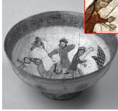
Resim 22. Selçuklu dönemi seramik kâse 1175-1220 Sava/İran - Minai tekniği Philadelphia Art Museum