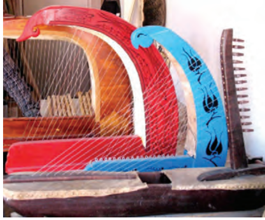
Resim 1. Çeng örnekleri 9 .

türüne aittir. Açık arpları, kavisli (arched) ve köşeli (angular) olmak üzere ikiye ayırmak mümkündür. Köşeli arpların boyun kısmı rezonatör ile keskin bir açı yaparken, kavisli arplar daha yumuşak bir eğime sahiptir 8 .