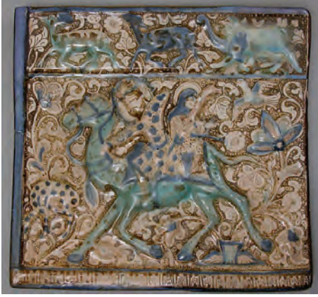
Resim 31. Frizden bir parça XII. yy. Kaşhan/İran - Lüster tekniği The Metropolitan Museum of Art