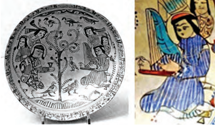
Resim 6. Selçuklu dönemi seramik kâse XII-XIII. yy. - İran Museum of Fine Arts Boston

Resim 6'da görüldüğü üzere seramik kâsenin sağındaki figür, elinde açık ve köşeli bir çeng tutar vaziyette yer almaktadır. Zarif el hareketleri ile çengi çalan kadın müzisyen, uzun saçları ve Orta Asya tipi kaftanı ile çizilmiştir. Figürler, Uygur minyatürleri gibi başlarında hâlelerle tasvir edilmişlerdir. Seramik kâsenin ortasında yer alan ağaç, Türk sanatında sıklıkla görülen hayat ağacı; solda elinde kadeh tutan figür ise hükümdarı simgeliyor olmalıdır. Seramik dekorunda resmedilen bu sahne, hükümdarın bulunduğu bir ortamdaki eğlenceyi göstermektedir. Bu sahne, sonraki dönem Türk sanatında da yer alır. Yine sarayda eğlence temalı bir seramik eser aşağıda sunulmuştur.