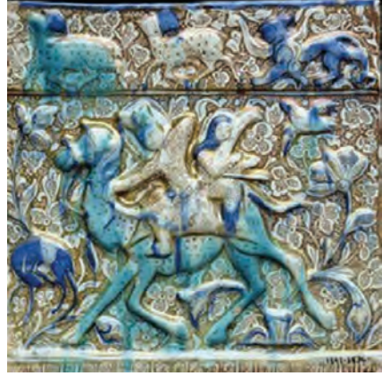
Resim 32. Frizden bir parça XII-XIII yy. Kaşhan/İran - Lüster tekniği Victoria & Albert Museum

Resim 31 ve Resim 32'de birbirlerine çok benzer iki çini örneği görülmektedir. Yine çeng çalan kadın figürünün yer aldığı bu eserler, günümüzde New York Metropolitan ve Londra Victoria & Albert Müzelerinde sergilenmektedir. Eserlere lüster tekniği uygulanmıştır. Lüster uygulaması, sırlanmış seramiklere metalik bir parlaklık ve optik etkiler vermek için yapılır 31 . Büyük Selçuklulara ait pek çok eserde bu uygulamayı görmek mümkündür. Oturmuş, ata ya da deveye binmiş küçük figürlere koyu renk ışıltılı lüster, beyaz sır ile uygulanarak canlı bir görünüm elde edilmiştir 32 .