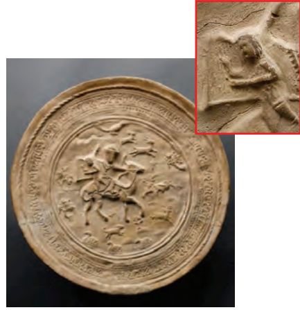
Resim 18. Selçuklu dönemi sırsız seramik tabak - XII-XIII. yy. - İran Louvre Museum - Paris