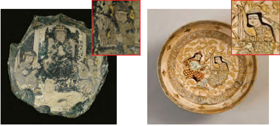
Resim 15. (solda) Selçuklu dönemi seramik parça - XII.yy.sonu-XIII.yy.başı - Kaşan/İran Mina'i tekniği (Princely Collection 2010, No: 83) Chicago Sanat Enstitüsü'nde sergilenmiş, Harvey B.Plotnic Koleksiyonu'na ait bir eser.