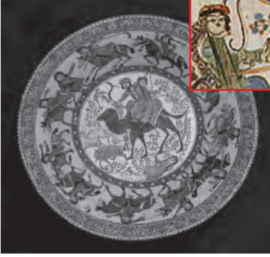
Resim 21. Selçuklu dönemi seramik kâse XII-XIII. yy. - İran - Minai tekniği The Metropolitan Museum of Art