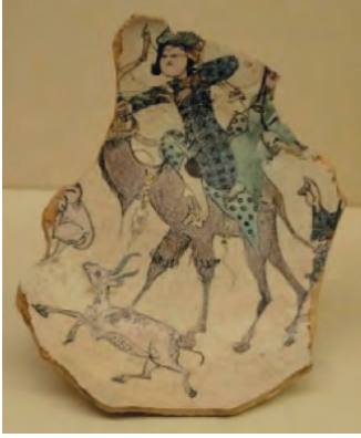
Resim 25. Selçuklu dönemi seramik tabak XII-XIII. yy. - İran - Gulbenkian Museum - Lizbon