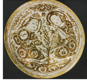
Resim 11. (solda) Selçuklu dönemi seramik tabak - XII-XIIIyy. Kaşhan/İran - Isabelle Stewart Gardner Museum - Boston;