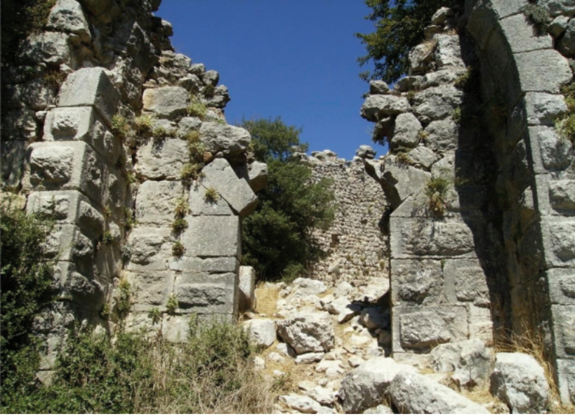
Resim 1: (Uğurlubağ Kalesi)