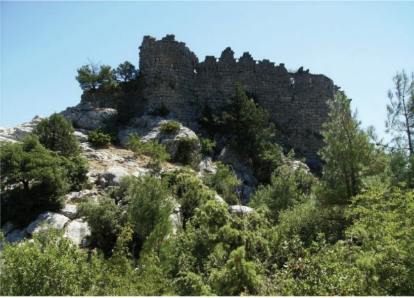
Resim 2: (Uğurlubağ Kalesi)