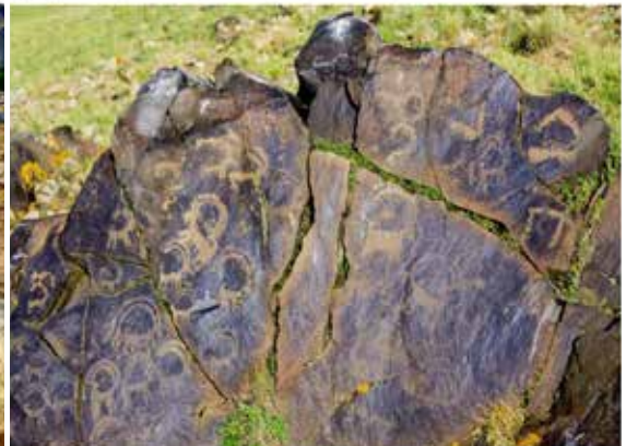
Resim 2.-3. Saymalı Taş Dağ Keçisi Figürleri