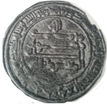
Şekil 2 : Sikkenin Arka Yüzü

Kur'an'ın 30. Suresinin (Rum Suresi) 3 ve 4. Ayetleri (Arapça) ( Bu ayetin meali şöyledir: Arab ülkesine en yakın yerde... Şüphesiz onlar bu yenilgi sonrası birkaç yıl içinde galip gelecekler, Önünde ve sonunda emir Allah'ındır. O gün Müslümanlar sevinirler.