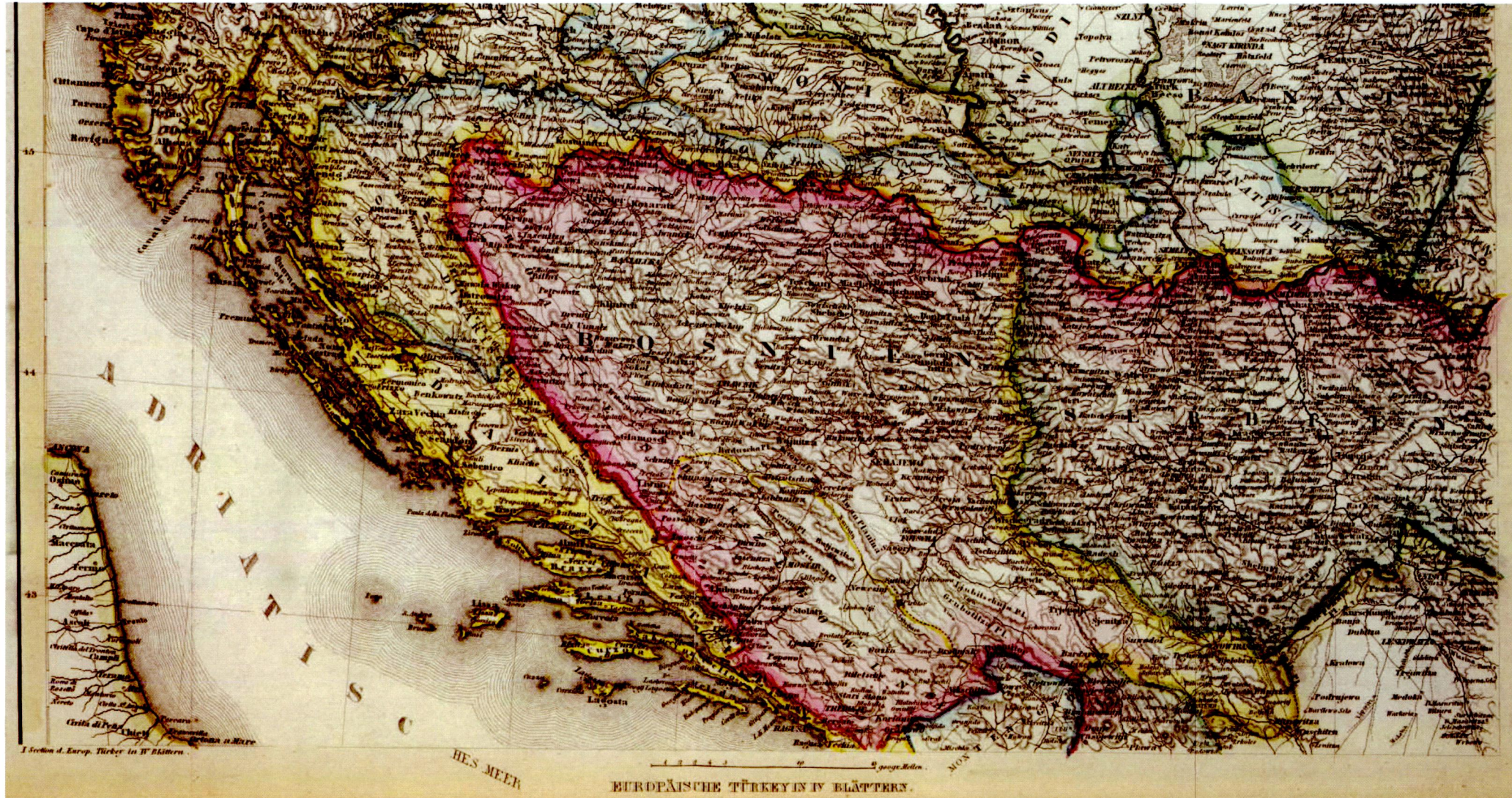
Harita 1: 1860'da Bosna Hersek ve Çevresi.