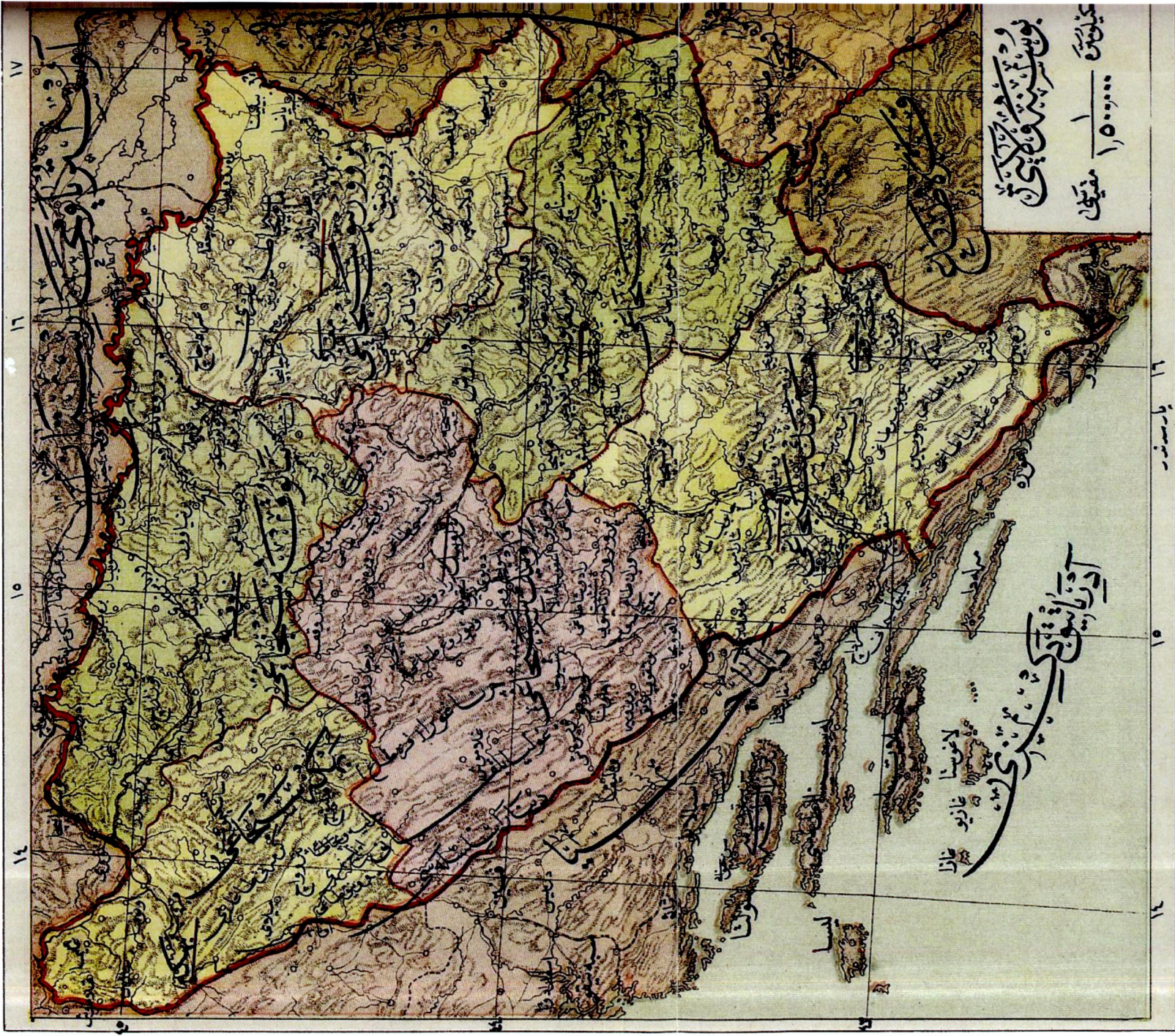
Harita 3: Avusturya İşgalinden sonra 1325/1907'de Bosna Hersek. Haritada Yenişehir Sancığı yer almamaktadır.