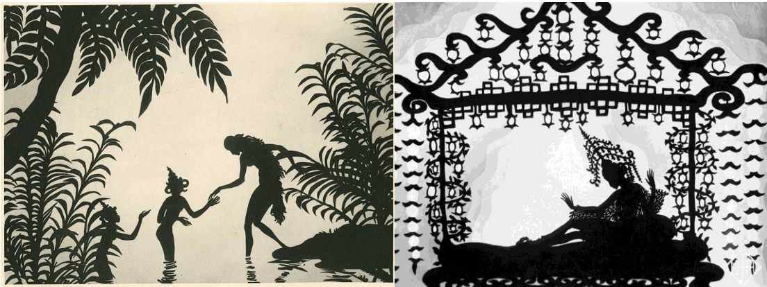
Resim 5. Prens Ahmed'in Maceraları.

Eski bir hikâyeyi hareketli bir sanata dönüştüren Reiniger'in silüet canlandırma filminin hikâyesi, Bağdat Halifesi Caliph'in güzel kızı Dinarsade'ye âşık olan Afrikalı kötü büyücünün, onu etkileyerek evliliğe ikna etmek için sihirli uçan bir at yaratması ile başlar. Halife bu sihirli uçan atı kendisine vermesi karşılığında ne isterse vereceğini söyler. Büyücü ise sihirli uçan atı verir ve karşılığında halifenin kızı Dinarsade ile evlenmek ister; fakat Dinarsade'nin ağabeyi Prens Ahmed bu duruma karşı çıkar (Kalkan, 2014: 6). Sihirli uçan atın Prens Ahmed'i kasıtlı olarak uzak diyarlara kaçırmasını sağlayan büyücü, evliliğine engel olamaması için film boyunca tüm kötülüklerini yapar. Vak-Vak ruhları adasına varan Prens Ahmed ilk görüşte Peri Banu'ya âşık olur. Afrikalı kötü büyücü'nün Peri Banu'yu kaçırmasıyla devam eden olaylar zinciri, Prens Ahmed'in onu kurtarmak ve sarayına geri dönmek için verdiği mücadeleleri konu alan canlandırma filminde tüm detaylara yer verilir (Resim 5.).