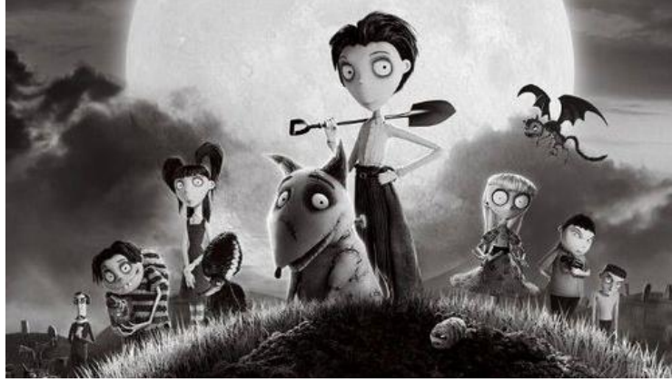
Resim 1. Tim Burton, Frankenweenie.