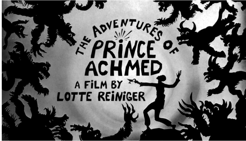
Resim 4. Prens Ahmed'in Maceraları.