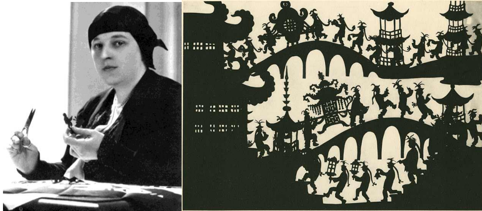
Resim 2. Lotte Reiniger ve silüetleri.