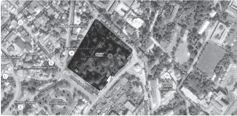
Şekil 2. Ayasofya Camii'nin MEGSIS ekran görüntüsü 20

Taşınmazın TKGM’de mevcut kadastro dayanak evrakı çalışma kapsamında öncelik durumu itibarı ile sunulmamıştır. TKGM verilerine göre, taşınmazın 1936 tarihinde belirlenen cinsi, aynen geçerliliğini korumakta ve tapu bilgileri ile kadastro bilgilerini içeren ekran görüntüsü şekil 2 ile aşağıda sunulmaktadır. Görüleceği üzere taşınmazın google-earth üzerine aktarılmış mülkiyet sınırları cami ve müştemilatını içine alacak şekilde mavi renkli olarak göze çarpmaktadır.