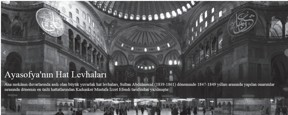
Şekil 1. Ayasofya Camii'nin MEGSİS ekran görüntüsü 19