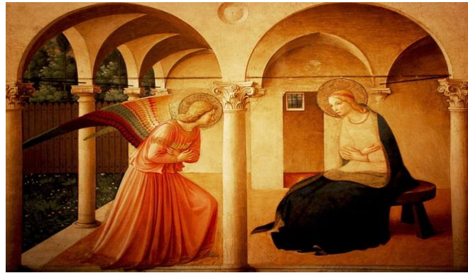
Şekil 9: Fra Angelico Fresk Sanatı