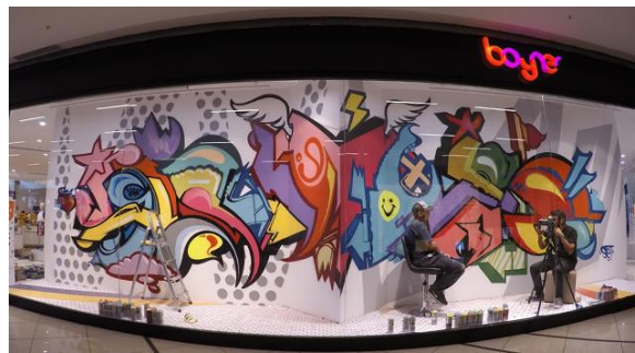
Şekil 4: Dünya üzerinde ilk reklam olarak kullanılan Boyner Mağazası Vitrini