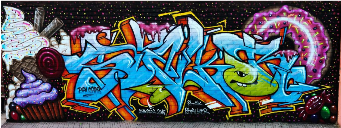
Şekil 1: Sokak Sanatı Grafiti

Esasen duvar yazısı anlamına gelen grafiti, duvarlara çizilen ve bu çalışmayı yapan kişinin isteğine göre hobi, şöhret, siyasi mesaj, sokakta yaşananlar vs. amaçlarla kompozisyonlar oluşturup bu şekilde sınırı olmadan şekillenen bir sanattır. Genellikle gençler tarafından icra edilen bu sanat; çıkış noktası itibariyle içerisinde illegaliz unsurlar taşımaktadır. İllegaliz ve Vandalizm grafikten türemiş kelimelerdir. İllegaliz; yasa dışı anlamına gelmektedir. Vandalizm ise; kişiye ya da kamuya ait mala araca veya ürüne zarar verme eylemidir. Grafitinin hip hop kültüründen geldiği düşünülmektedir. Hip hopun temelindeki Rap müzik ile grafiti sanatı birbiriyle etkileşim halinde uygulanmaya başlanmıştır. Gençler rap müziği eşliğinde duvarlara grafiti yaparak hip hop kültürünü yaşamaktadır. Bu etkileşimin sonuçları günümüzde ünlü pop müzik yorumcularının rap müziği sanatçılarıyla düet yapmalarına ve kliplerin de grafiti uygulamalarına ait görüntülere yer vermelerine kadar devam etmektedir. (2-2017)