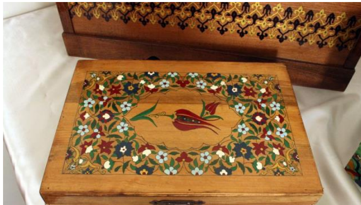
Şekil 6: Ahşap Boyama Sanatı Örneği

Ahşap eşyaların güzelleştirilmesi ve dış etkilerden korunması amacı ile yapılan boyama, özellikle de vernikleme M.Ö. 200 Yılında Çin Han devrinde bulunmuştur. O zamana ait çalışmalar, üst yüzey işlemleri yönünden oldukça yüksek bir düzeyi belirler. M.Ö. yapılan ahşap boyamalarında en çok kırmızı ve siyah renk kullanılmıştır.16.yy da ahşap boyama sanatı hakkındaki ilk bilgiler Avrupa ya ulaştığında büyük ilgi görmüş, basta İtalya olmak üzere Hollanda, İngiltere gibi birçok Avrupa ülkesinde geniş bir kesim tarafından çalışılmıştır. Mobilyaların boyanması ve üzerlerine resimler yapılarak süslenmesi ilk defa İtalya da moda olmuştur. Boyalı ve süslemeli mobilya modası hızla yayılmıştır.(9)