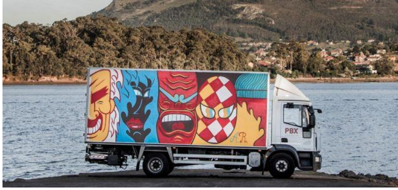
Şekil 5: Truck Art Project (Kamyonları Sanat Haline Dönüştüren Proje) “100 Kamyonu uygulandı”