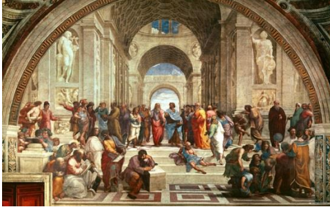
Şekil 8: Michelangelo Fresk Sanatı

Eski uygarlıkların çoğunda fresk sanatı uygulanmıştır: Az teklerde, Hindistan'da, Mısır'da, Roma'da, Yunanistan'da bunları görmekteyiz. Günümüzde bilinen en eski fresk, Mezopotamya'da (Irak) bulundu. Milattan önce üç bin yıllarından kalmadır. Duvar üzerine resim yapma tekniği ve bu teknikle yapılmış duvar resimleri, İtalyanca taze anlamına gelen "fresco"dan gelir. Fresk, yeni sıvanmış bir duvar üzerine, kireç suyunda eritilmiş boyalarla yapılan bir tür resimdir. Genellikle sanıldığı gibi tersine bu terim, herhangi bir duvar resmi tipini değil; kuru ve sert badanalar üzerine yapılan resimlere karşıt, özel bir tekniği belirtir. Fresk, özellikle İtalya'da ve XIV. yy.dan XVI. yy .a kadar Giotto, Fra Angelico, Piero Della Francesca, Uccello, Raffaello ve Michelangelo gibi sanatçılarla tanınmıştır.(5-2017)