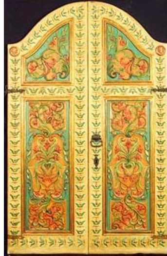
Şekil 7: Edirne Kari Kapısı

sanatıyla kök boya ve altın varak ile nakışlar yapılmış, lake denilen cila yapılarak son haline getirilmiştir. Bu bezeme sanatının çıkış noktası saray kenti Edirne'dir. Kapı kanatları, tavanlar, çeyiz sandıkları, dolap kapakları, para kutuları, ahşap pencere kepenkleri ve cilt kapaklarında kullanıldığı görülmüştür. Kimi zaman diğer ahşap süsleme teknikleriyle de beraber kullanıldığı olmuştur. Bunlar ahşap üzeri kakma ve oyma sanatlarıdır.(9)