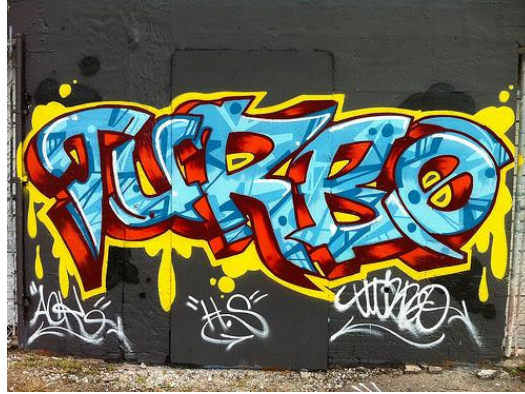
Şekil 3: Turbo SGK 2

sokaklarında sıkça grafitiye rastlayabilirsiniz. Ülkemizde en ünlü grafiti ustası Tunc Dindaş nam-ı diğer Turbo-s2k'dir. (7-2017)