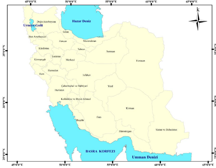
Harita1: İran'da İllerin idari Bölünüş Haritası (1979).