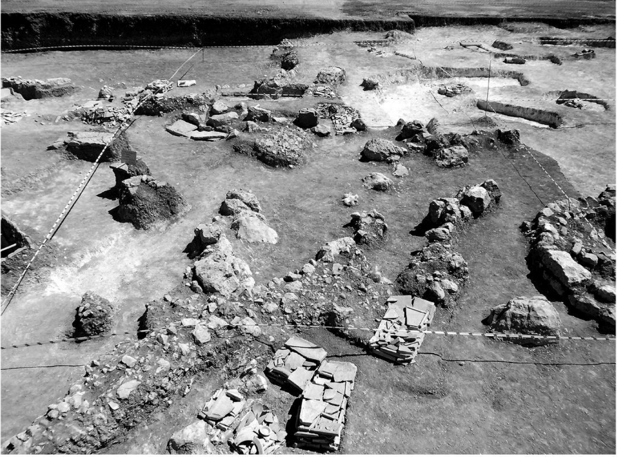
Resim 7. Samurlu Nekropolisi Genel Görünüm (Ürkmez 2014, Resim 2)