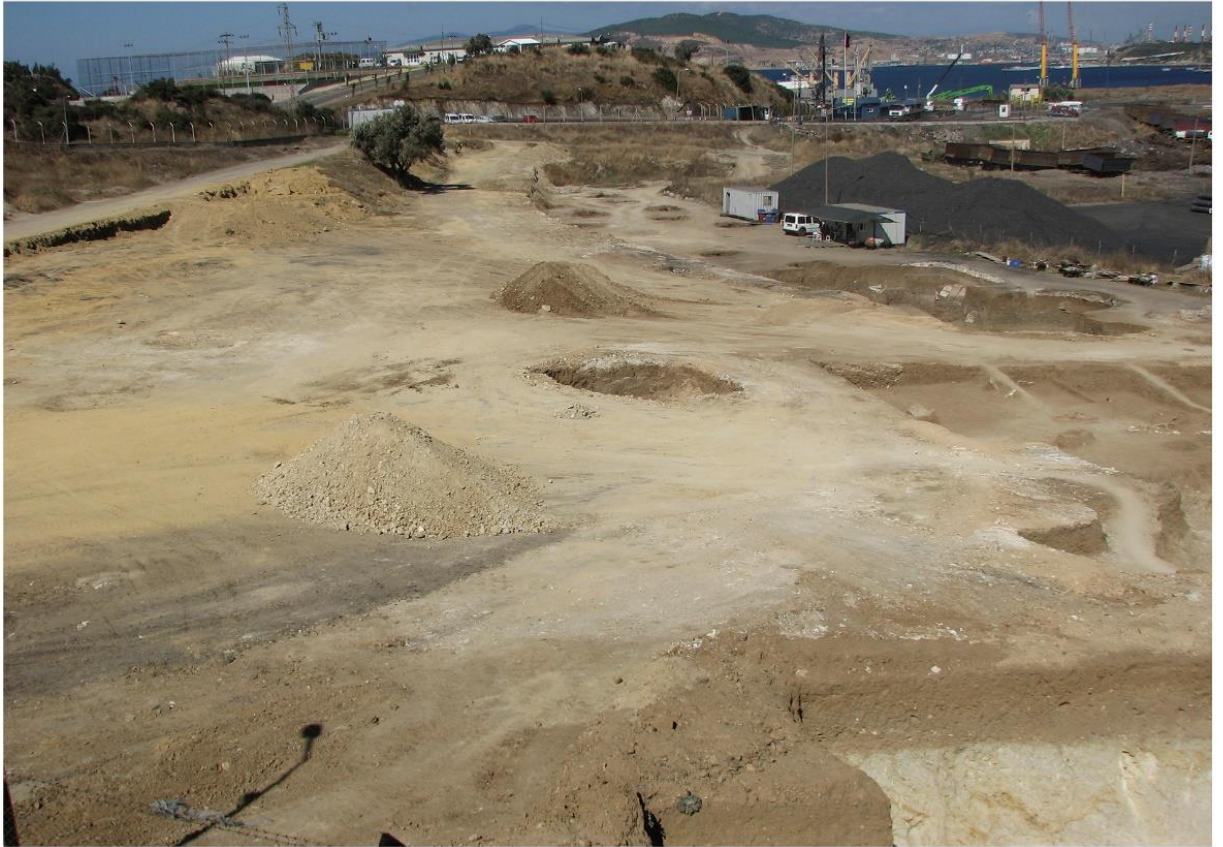
Resim 4. İDÇ Nekropolisi Genel Görünüm (Foça 2011, Resim 1-b)