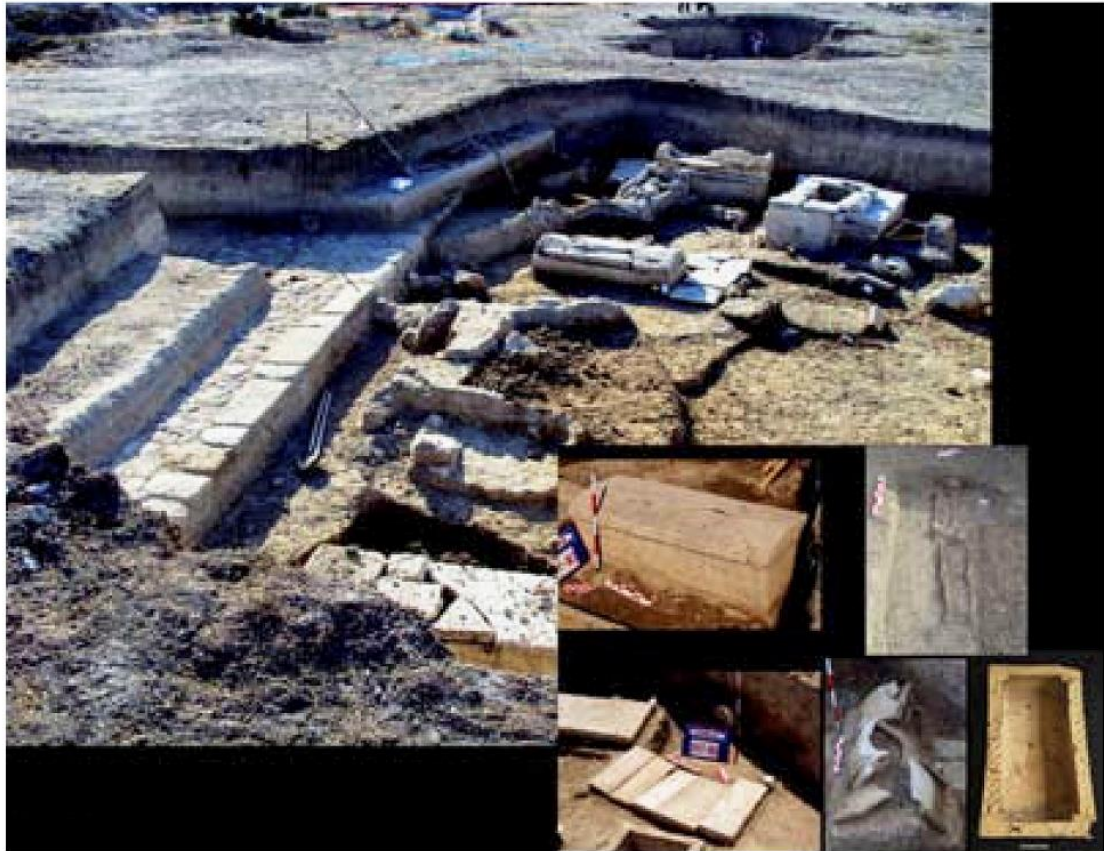
Resim 6. Habaş Nekropolisi Genel Görünüm (Korkmaz ve Gürman 2012, Resim 2)