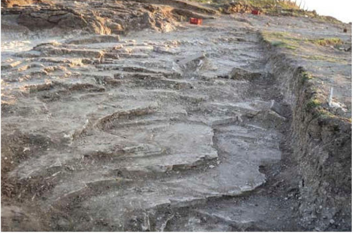
Resim 5. Batı Liman Nekropolisi Genel Görünümü (Konak ve Selçuk 2012, Resim 2)