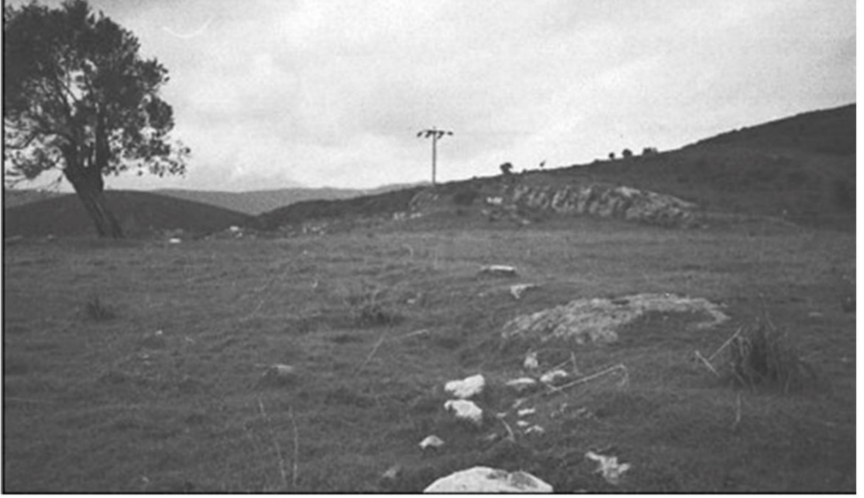
Resim 3. Gümrük Alanının Genel Görünümü (Ünlü ve Özsaygı 2007, Resim 1)