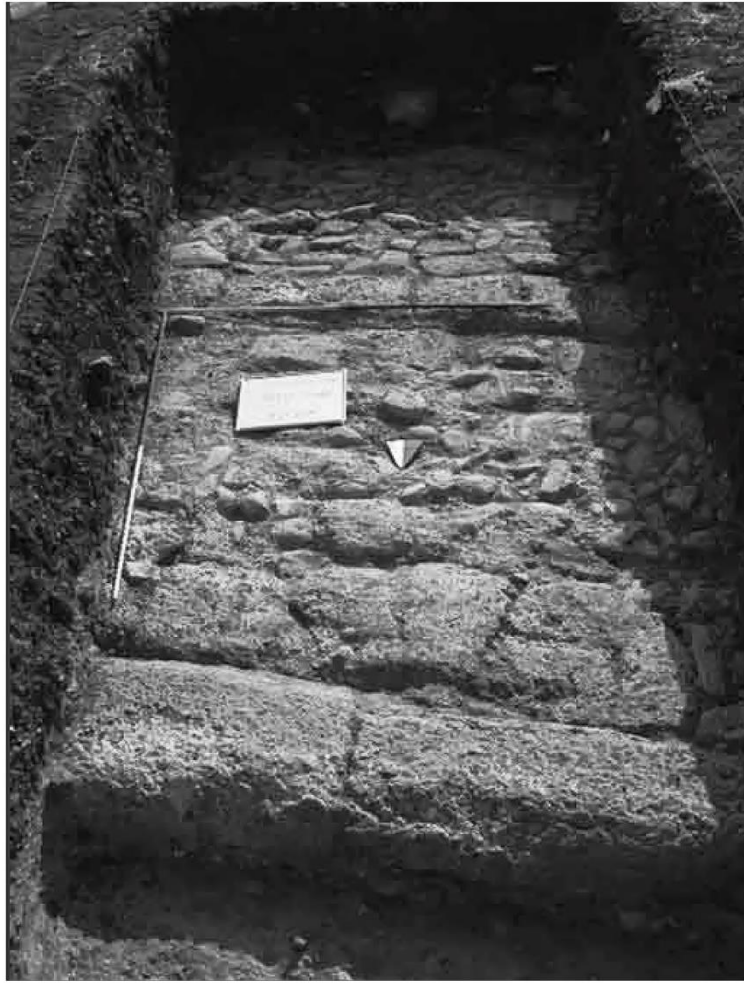
Resim 2. Dört Yıldız Nekropolisi'nde ortaya çıkarılan Roma Dönemi'ne ait yol (La Marca 2010, Resim 9)