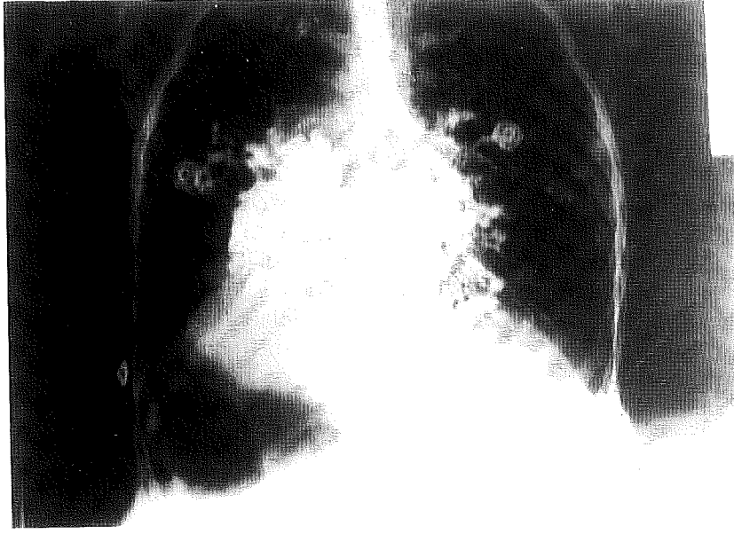
Şekil 2. Bronkografide her iki akciğer orta ve alt loba sakküler tip bronşiektazik alanlar