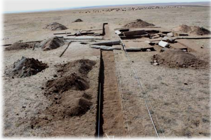
Dongoin Şireen Anıtları'ndaki İlk Açmalar