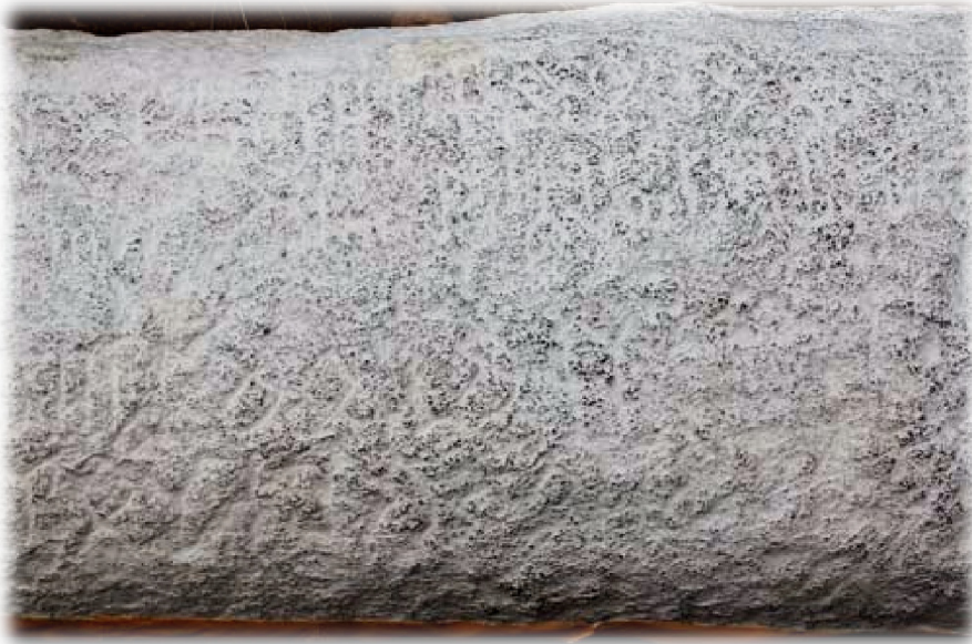
Dongoin Şireen Anıtları'ndan Stampaj Örneği