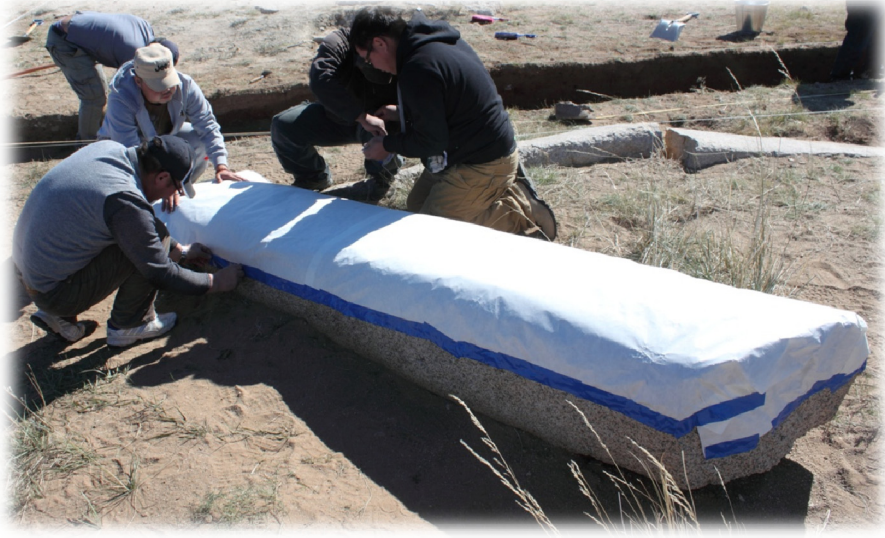
Dongoin Şiree Anıtları'ndan Stampaj Alımı