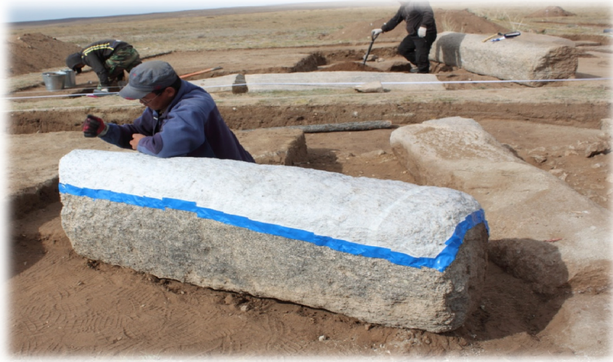
Dongoin Şireen Anıtları'ndan Stampaj Alımı