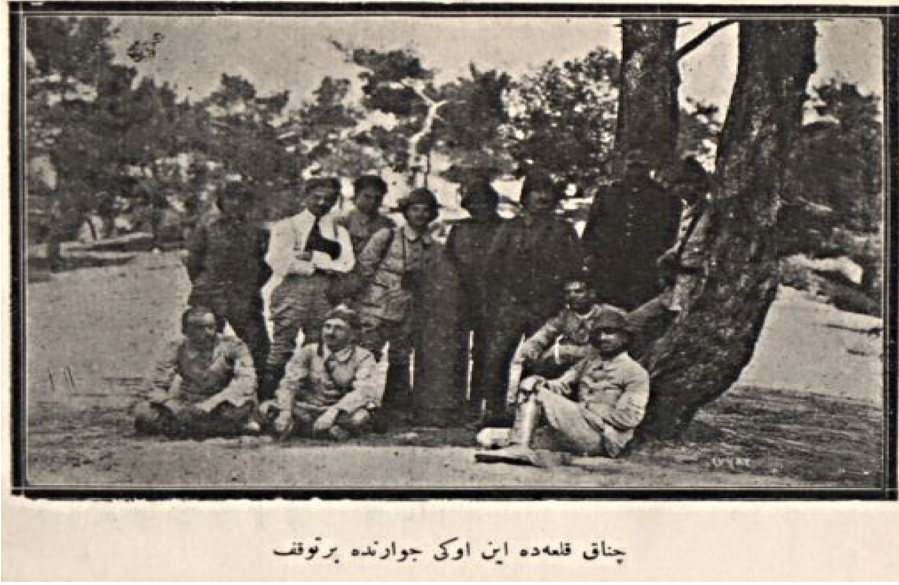
EK: IV: Heyetin, Çanakkale İnönü Civarında Bir Tevakkuf(u) “Çanakkale İzleri 1926, s. 32-33”