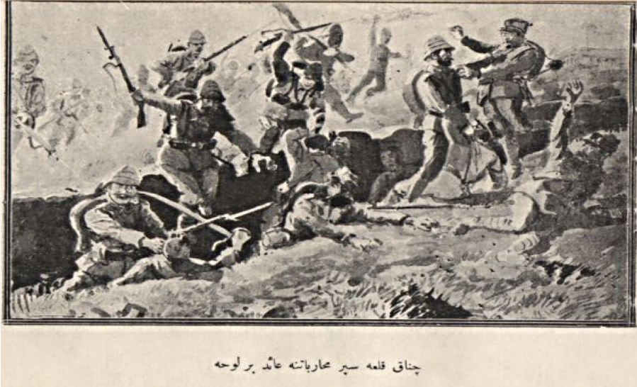
EK: V: Çanakkale Siper Muharebatına Ait Bir Levha “Çanakkale İzleri-Sulh ve Harp 1926, s. 64-65”