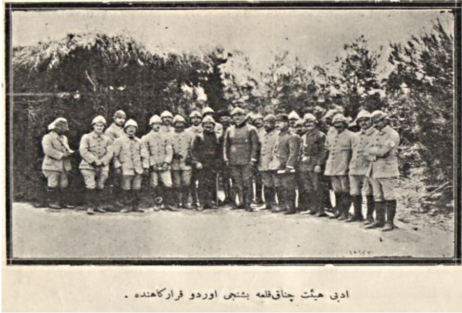
ادبی ہیئت چناق قلعه بشتیجی اوردو قرارگاهندہ .

EK: II: Heyet, Bolayır'da Kemal'in Yıkılan Kabri Başında “Çanakkale İzleri 1926, s. 48-49”