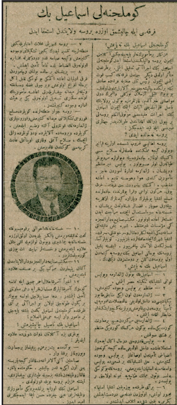
Ek-3: Gümülcinelî İsmail Bey'in İcraatını aktaran gazete haberi. (Alemdar, 20 Mayıs 1335/1919, Nu: 148-1458, s. 19.