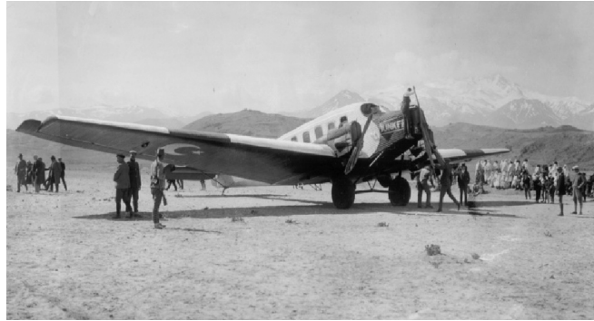
Açılış Törenine Katılımcıları Taşıyan Junkers G-23