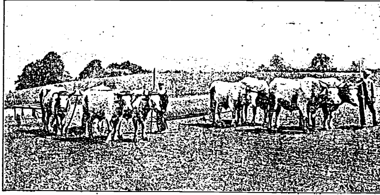
چنکلرده ایلك هزار عملاندن

عشائی زراعت جمیئی مفتعلی بند سیاسی : اسماعیل مشتاق بک