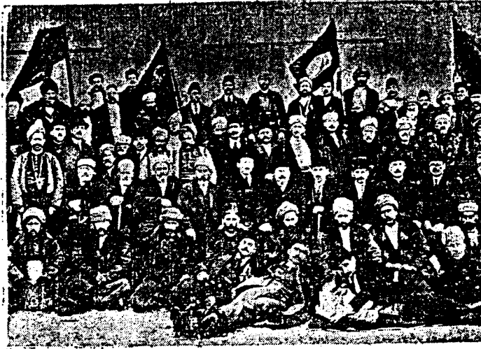
مونیوده المهاد این بولناریستان چغتیی قوتورسنه نورکه زراعت فرعی وزیرات چغتیی نامه مرشیس اولهوق اشتراك ابدل جواد رشدی بکلا بولناریستان سادان مینوئری ویتتی مرشیردن مرگت بر مرزوب

تومره ۱۱ ۱ مارت ۱۳۳۷ سال ۲۲ جادی الاخر ۱۳۳۹ برنجی سنه