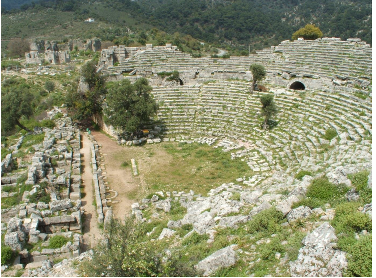
Kaunos Antik Tiyatro, Muğla