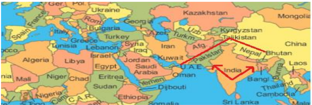
Şekil 3. ÇPEK İle Hindistan'ın Çevrenmesi

Soğuk Savaş başladığında dünyada komünist bloğun başını çeken Sovyetler Birliği ve kapitalist bloğun başını çeken ABD olmak üzere çift kutuplu bir sistem oluşmuştu. ABD ve Sovyetler Birliği, nüfuz alanlarını genişletmek amacıyla bloklar arasında tarafsız kalan ülkeleri kendi taraflarına çekmek istemekteydiler. Bu dönemde ayrıca ABD'nin Sovyetler Birliği'ni çevreleme stratejisi olduğu da bilinmektedir. Bu amaçla ABD çeşitli askeri ve teknik yardımlar ile Pakistan'ı kendi tarafına çekmeyi başarmıştır. CPEK'in jeostratejik önemi de burada ortaya çıkmaktadır. Geçmişte ABD'nin Sovyetler Birliği'ni ve Çin'i çevrelemek için ilişkiler geliştirdiği Pakistan, Çin ile CPEK projesi kapsamında başta ekonomi olmak üzere askeri ve kültürel ilişkilerini geliştirmektedir.