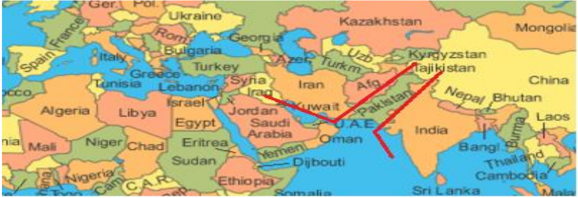
Şekil 2. Pakistan'ın Jeostratejik Önemi

Soğuk Savaş başladığında dünyada komünist bloğun başını çeken Sovyetler Birliği ve kapitalist bloğun başını çeken ABD olmak üzere çift kutuplu bir sistem oluşmuştu. ABD ve Sovyetler Birliği, nüfuz alanlarını genişletmek amacıyla bloklar arasında tarafsız kalan ülkeleri kendi taraflarına çekmek istemekteydiler. Bu dönemde ayrıca ABD'nin Sovyetler Birliği'ni çevreleme stratejisi olduğu da bilinmektedir. Bu amaçla ABD çeşitli askeri ve teknik yardımlar ile Pakistan'ı kendi tarafına çekmeyi başarmıştır. CPEK'in jeostratejik önemi de burada ortaya çıkmaktadır. Geçmişte ABD'nin Sovyetler Birliği'ni ve Çin'i çevrelemek için ilişkiler geliştirdiği Pakistan, Çin ile CPEK projesi kapsamında başta ekonomi olmak üzere askeri ve kültürel ilişkilerini geliştirmektedir.