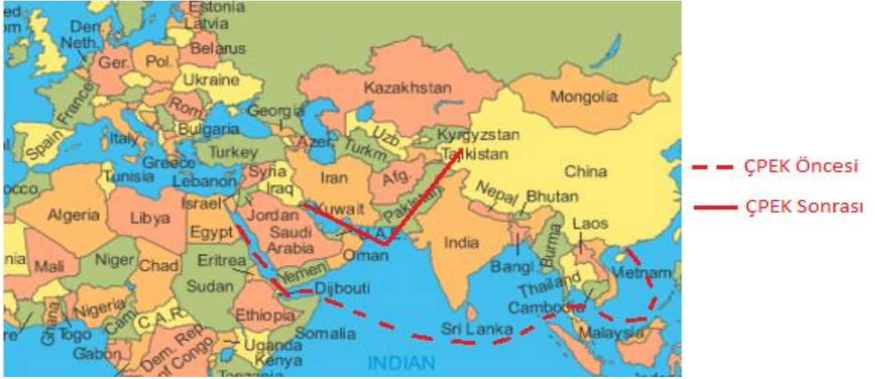
Şekil 5. ÇPEK Öncesi ve Sonrasında Çin'in Enerji Güzergahı

Çin'in Afrika'dan ithal edeceği hammaddeler, Körfezden ve Orta Asya'dan ithal edeceği petrol ve doğalgaz için de ÇPEK stratejik önemdedir. Çin için Güney Çin Denizi giderek daha sorunlu bir alan olmaya başlamıştır. Çin'in Güney Çin Denizi'nde yapay adacıklar oluşturarak sahiplik iddia etmesi Malezya, Endonezya, Vietnam, Tayvan, Filipinler, Tayland gibi Güney Çin Denizi'ne kıyısı olan ülkeleri rahatsız etmektedir.