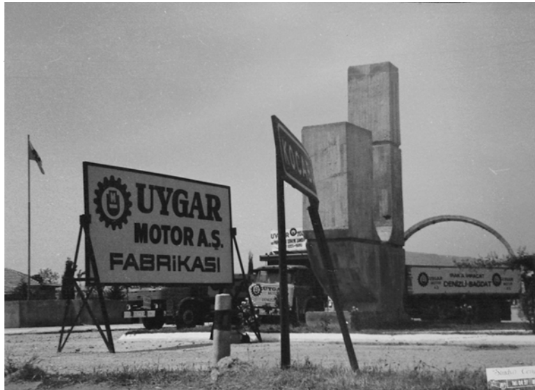
Ek 3: Uygar Motor 80'li yılların sonunda Irak'a ihracat yapan şirketlerden biri olmuştur.