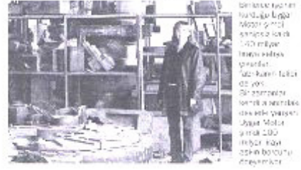
Ek 2: Uygar motorun iflasına dair Milliyet gazetesinin 26 Şubat 1996 tarihli nüshası