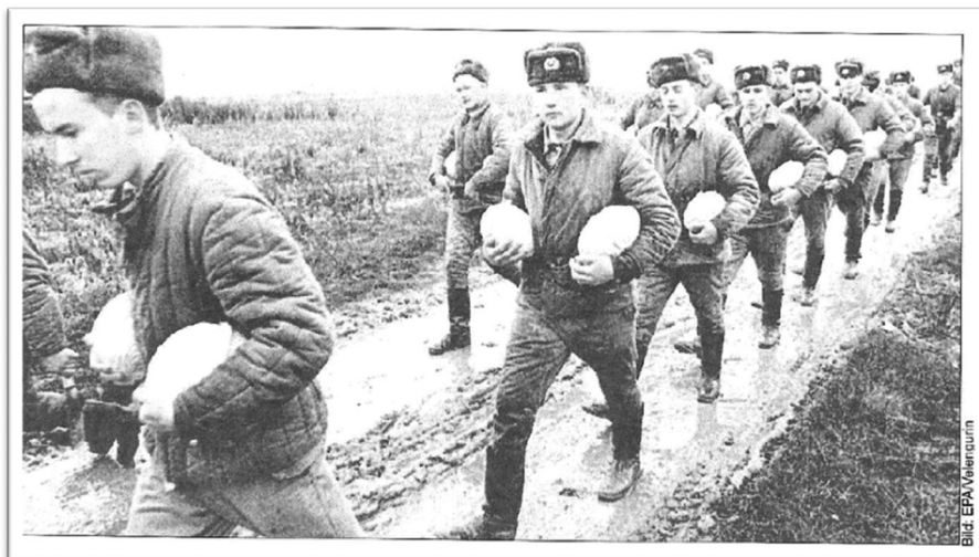
Exhibit-2: Cabbage as a Wage for Russian Soldiers.

Source: Egbert Apfelknab, Weltpolitische Entwicklungen. Eine Bestandsaufnahme über globale und regionale Konfliktszenarien aus wehrpolitischer Sicht , Eine Information des BMLV Büro für Wehrpolitik, April 1997, Wien, p. 13.