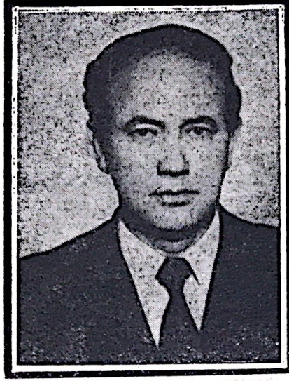
Fahri Gökcan (1933 — 1979)