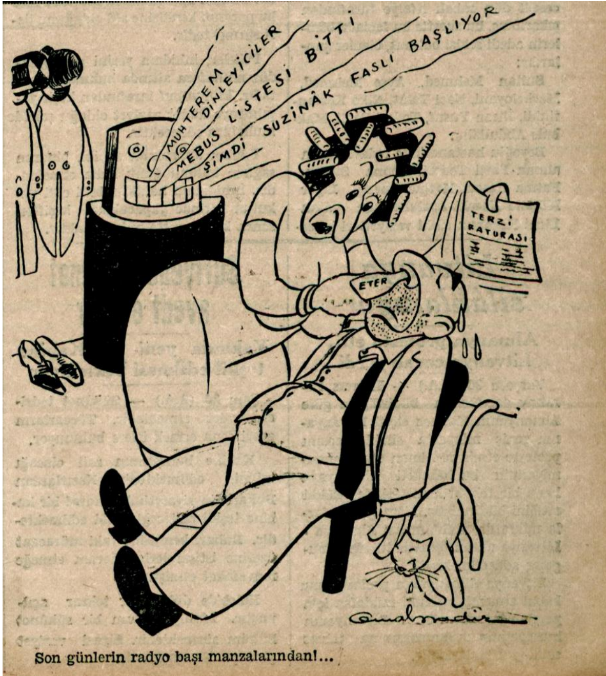
Ek 8: Akşam Gazetesi, 27 Mart 1939, nr. 7342, s. 1. Kıyafet masraflarının lüks tüketime girmesi