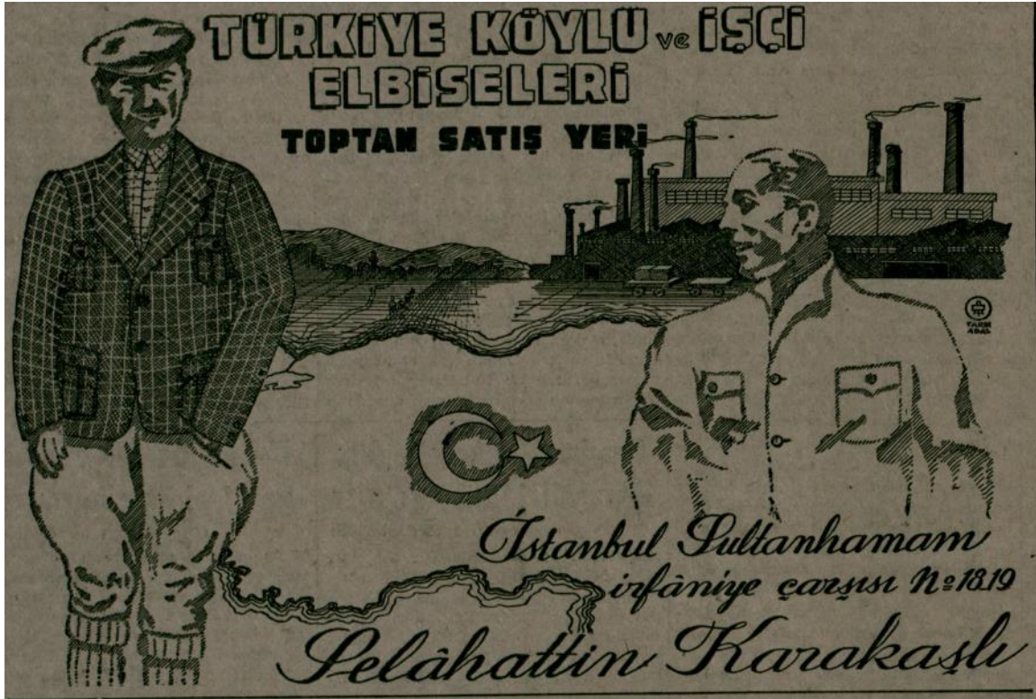
Ek 4: Cumhuriyet Gazetesi, 16 Mart 1943, nr. 6673, s. 4. Köylü ve işçi elbiseleri toptan satış merkezi