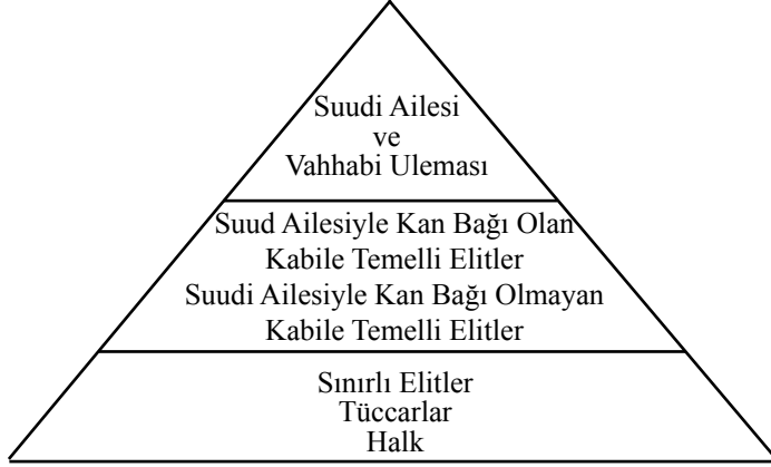
Şekil 1. Suudi Arabistan'daki Hiyerarşik Siyasal Yapılanma