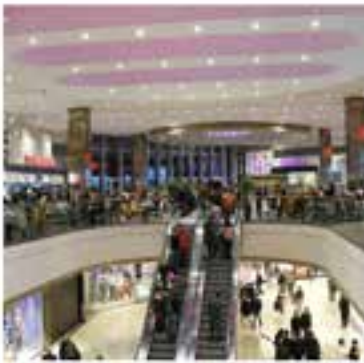
Optimum Outlet / Floors

Üsküdar University Journal of Social Sciences Year:2 Issue:2