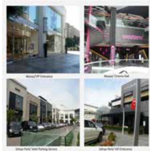
Photos: Akasya Mall, Istinye Park Mall