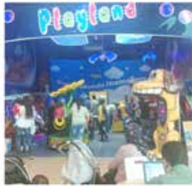
Optimum Outlet / Playland