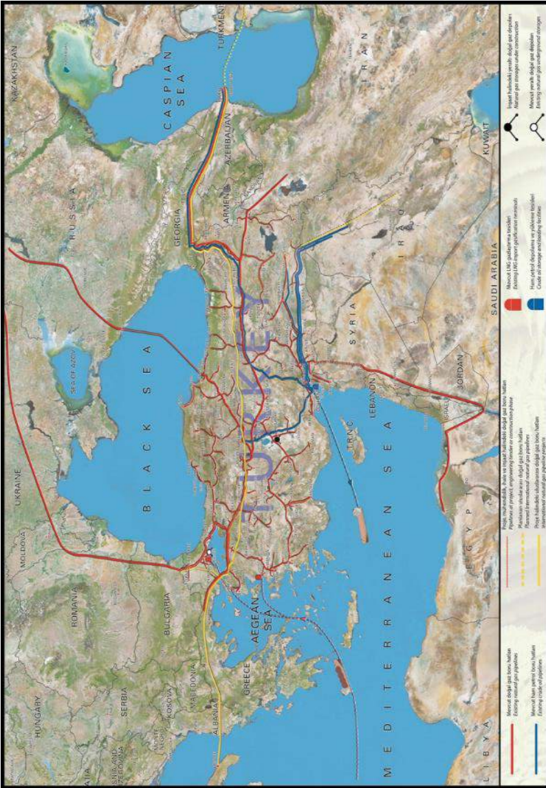
Map-1: Current Natural Gas and Crude Oil Pipelines and the Pipelines Planned or in the Form of Project