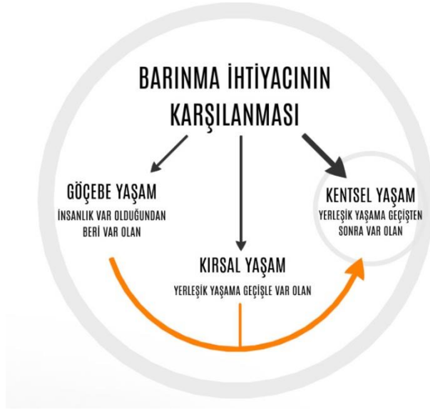
Resim 3: Barınma Şekilleri

Tüm bu değişim sürecinin içinde kentleri, kent-kır karşıtlığı ile tanımlamak mümkün değildir. Kırsal alanlar ve kentsel alanlar yaşanan gelişmelerle nitelik değiştirmektedir. İnsanlığın temel ihtiyaçlarından olan barınma ihtiyacı, Resim 4’de de görüldüğü üzere, üç temel formla karşılanmaktadır. Bu tarihsel süreçle gelişen formlar coğrafyalarda da aynı zamanda bulunmaktadır. Tarımsal üretim başlamadan önce yerleşik yaşama geçmemiş olan insanlar barınma ihtiyaçlarını göçebe olarak sağlamaktaydı. Tarımsal üretimin başlaması ve yerleşik yaşama geçilmesi ilk kırsal yerleşimleri oluşturmuş ve tarımda ki artı ürün bunların pazarlanması gibi nedenlerle ticari faaliyetler başlayarak ilk kentsel yapılar oluşmaya başlamıştır. Tüm bu kırsal ve kentsel oluşumlar yaşanırken aynı zamanda hala farklı toplumlar barınma ihtiyaçlarını göçebe olarak sağlamaktaydı. Günümüzde kentlerde dünya nüfusunun yarısından fazlası yaşamaktadır. Bu kentsel yaşamın popüler bir barınma şekli olduğunu ortaya koymaktadır. Ancak değişen kentsel dinamikler bu durumun hala aynı mı kalacağı sorgulamasını yapmamıza sebep olmaktadır.