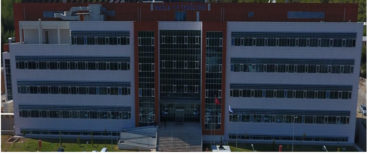
Muğla Sıtkı Koçman Üniversitesi Tıp Fakültesi