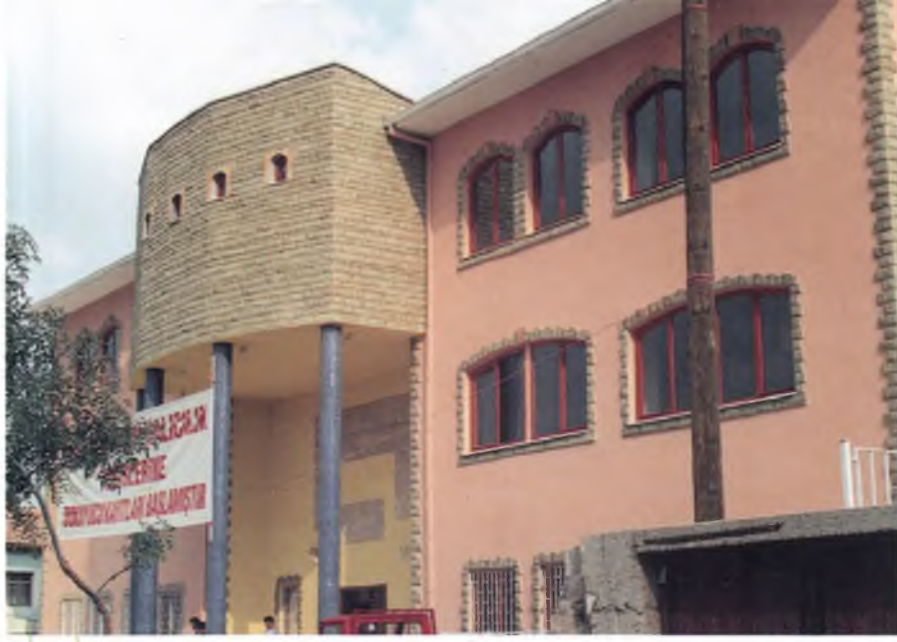
Sedirler Halı Merkezinin dış görünümü. General View of Sedirler Centre of Carpet.