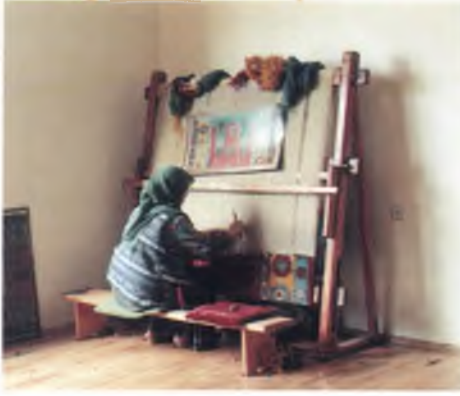
Halı dokuyan kadınlar. Women weaving carpet.