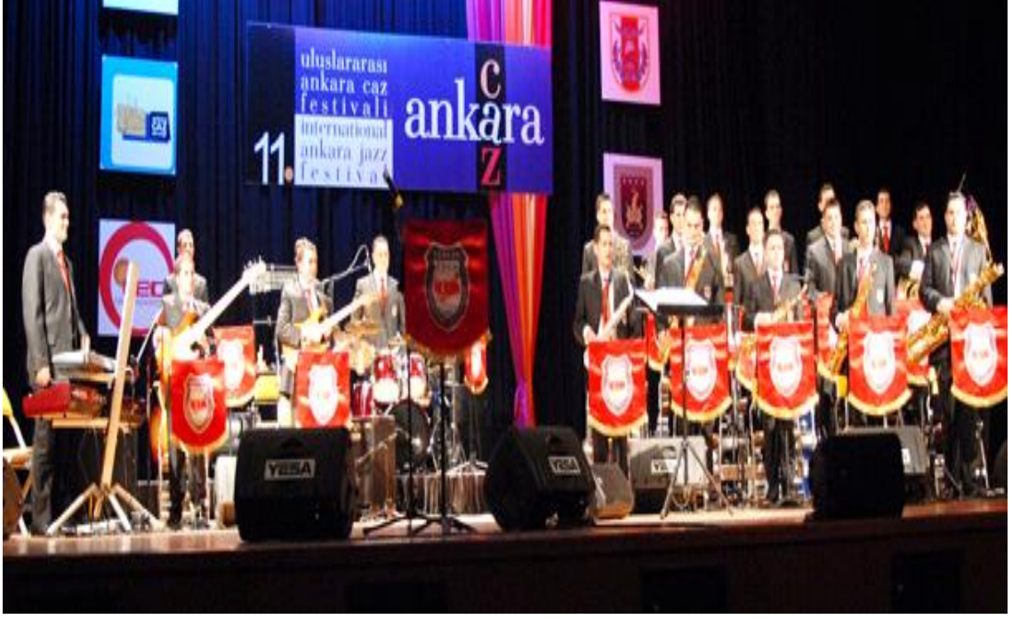
F.5: Uluslararası Ankara Caz Festivalinde Bando Astsubaylarından oluşan icracılar