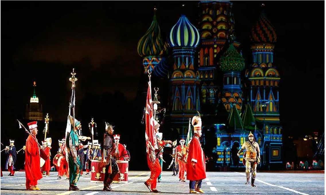
F.4: Askeri Bandolar Festivalinde Bando Astsubayları olan icracılardan oluşan Mehter Moskova /Rusya