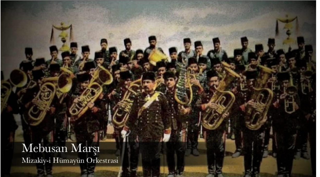
F.2: Osmanlı dönemi askeri bando