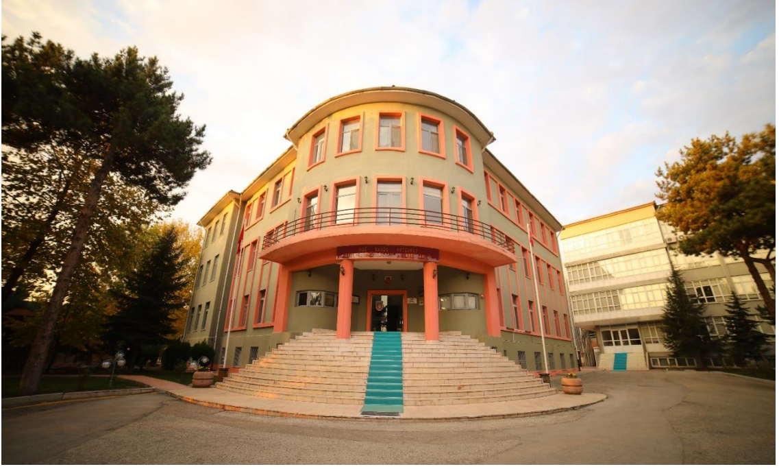
F.3: Bando Astsubay Meslek Yüksek Okulu