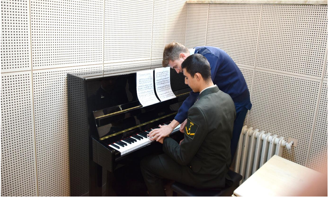
F.7: Bando Astsubay Meslek Yüksek Okulu'nda piyano eğitimi