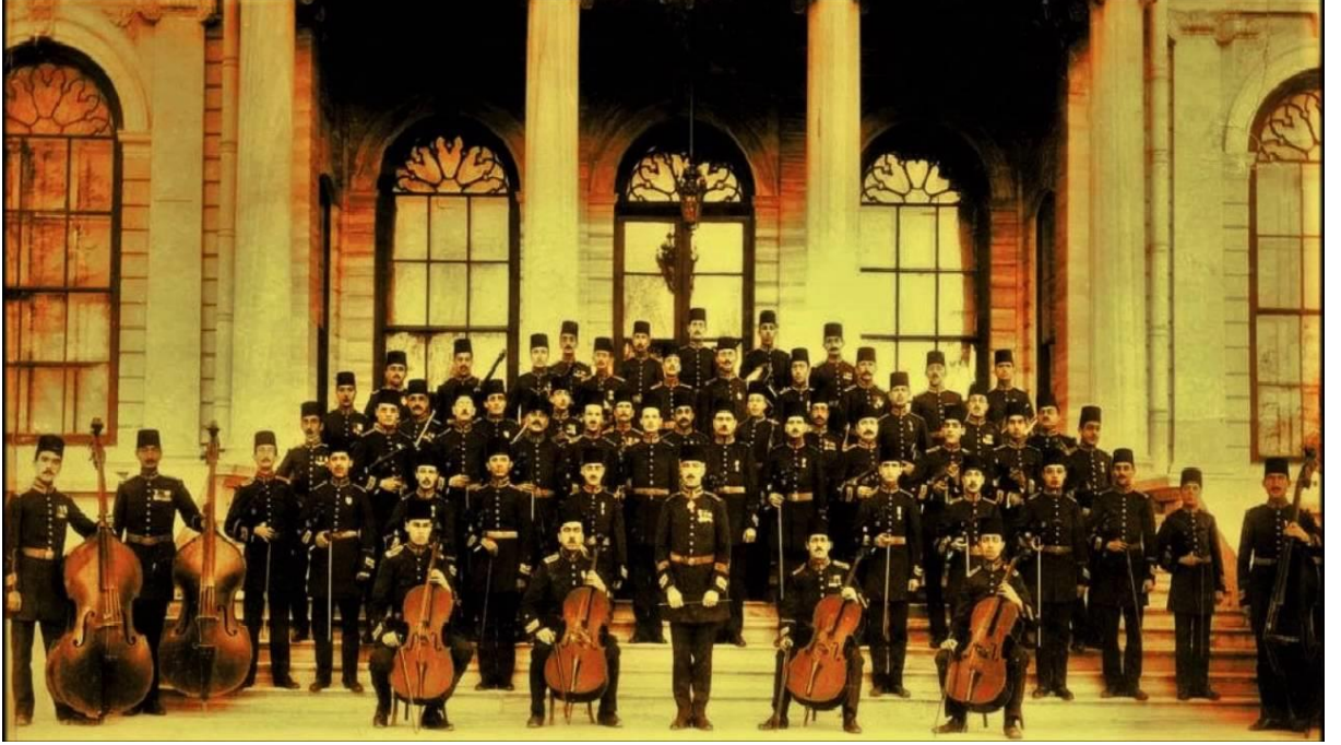
F.1: Osmanlı dönemi askeri bando