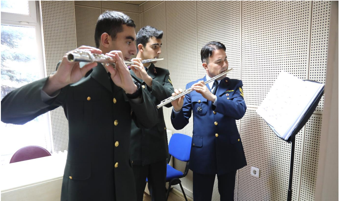
F.6: Bando Astsubay Meslek Yüksek Okulu'nda enstrüman eğitimi