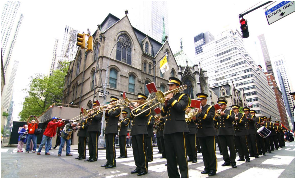
F.8: Türk Günü Kutlamaları Newyork/ABD