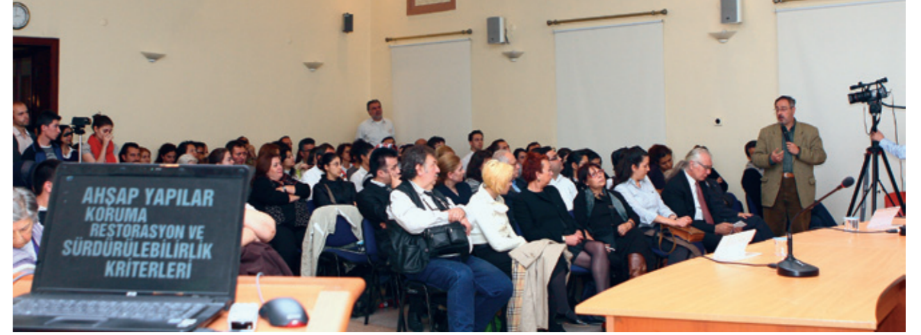
Panelden genel görünüm

“Restorasyon ve Konservasyon Çalışmaları” adlı derginizin göndermek lutfunda bulunduğunuz ikinci sayısı için çok teşekkür ederim. Derginizi, kültürel varlıkların korunması ile ilgili konuyu bir tutku haline getirmiş biri olarak, zevkle, heyecanla ve sevinçle karşıladığımı bilginize sunmak isterim. Dergi, sunuluş şekli, içeriği, fotoğraf ve diğer görselleri ve tasarım şekli ile, konuyu layık olduğu ciddiyetle yansıtmakta ve yetkin danışma kurulunun imajına da uygun düşmektedir. Kültürel varlıklarımızın korunması alanında bir dergi, hepimizin düşlediği bir şeydi sanırım. Bunu gerçekleştirmiş olanları can-ı gönülden kutlarım. Tabii en büyük dileğim, bunun sürekliliğe kavuşması, kolay ulaşılabilir olması ve ileride herkesin ilgisini çekecek ve katılımını sağlayabilecek niteliğe kavuşmasıdır.