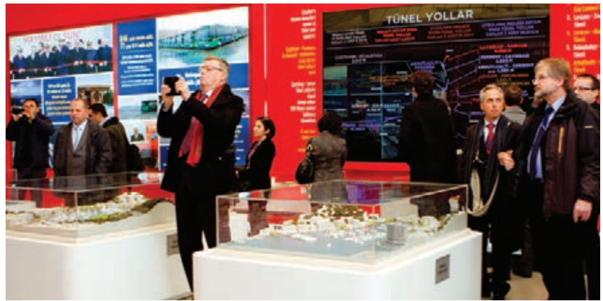
METREX üyeleri İBB Proje Tanıtım ve İletişim Çadırı'nda projeler hakkında bilgi aldılar

İstanbul'da son dönemde yapılan ve projelendirilen üst ölçekli ulaşım projelerini anlatan bir sunum yaparak METREX üyelerini bilgilendirmiştir.