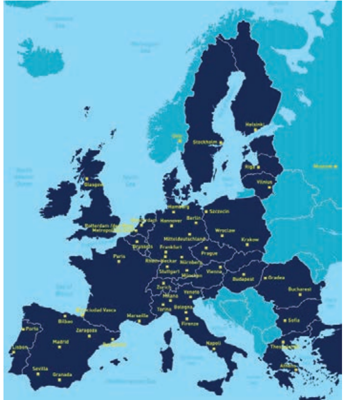
METREX üyesi şehirler

Avusturya (Viyana); Belçika (Brüksel); Bulgaristan (Sofya); Çek Cumhuriyeti (Prag); Danimarka (Kopenhag); Finlandiya (Helsinki); Fransa (Paris, Marsilya); Almanya (Berlin, Bonn, Frankfurt, Hamburg, Hannover, Mitteldeutschland, Münih, Nurnberg, Rhein-Neckar, Stuttgart); Yunanistan (Atina, Selanik); Macaristan (Budapeşte); İtalya (Bolonya, Genova, Milano, Napoli, Roma, Torino, Venedik); Hollanda (Amsterdam, Rotterdam); Polonya (Krakow, Szczecin, Wroclaw); Portekiz (Lizbon, Porto); Romanya (Oradea, Bükreş); Rusya (Moskova, NP Cities Globally United); İspanya (Barselona, Bilbao, Eurocity Bascue, Granada, Madrid, Sevilla, Zaragoza); İsviçre (Zürih); İngiltere (Glasgow, Londra, South Coast Metropole)