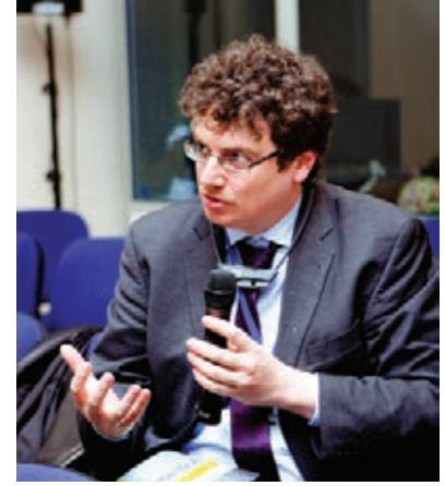
METREX üyeleri İstanbul sunumlarını ilgi ile dinlediler ve sorular yönelttiler.

anahtar konuları ve sorunları dinlemek ve bunlara çözüm önerileri getirebilmektir.