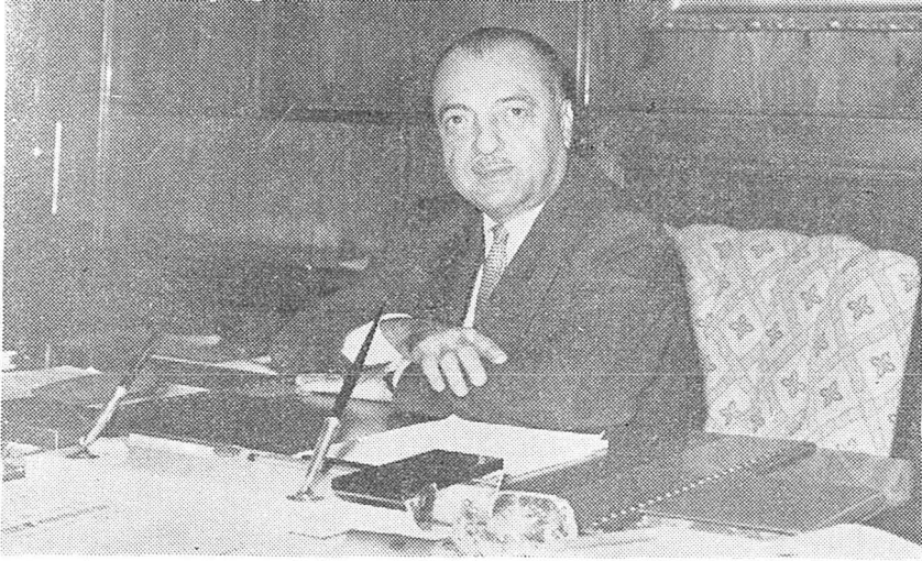
Tarım Bakanımız Sayın Cavit ORAL