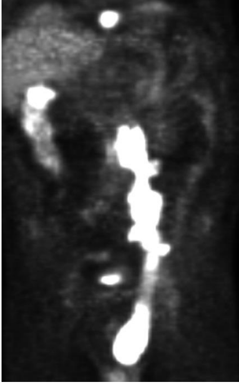
Şekil 1: F-18 Fluorodeoksiglukoz Pozitron Emisyon Tomografi (FDG PET): Yumuşak dokuda ve çıkan kolonda diffüz, boyun-mediasten-akciğer-kas grupları içerisinde ve batında lokalize olmak üzere çok sayıda hipermetabolik kitle ve sol femurda litik özellikli lezyon. Prostat bezi sol üst lateralde yerleşimli yoğun hipermetabolik odak (SUVmax: 18.4) izlendi.

Prostat lezyonuna yönelik yapılan sorgulamada üriner sisteme ait spesifik bir şikayet saptanmadı. Dijital rektal muyanede, prostat dokusu normal boyutta ve kıvamı elastik olarak değerlendirildi. Laboratuvar incelemesinde böbrek ve karaciğer disfonksiyonu düşündürcek bulgular; Kreatinin, aspartat aminotransferaz, alanin aminotransferaz, gama glutamil transferaz ve laktat dehidrojenaz yüksekliği görüldü (Kreatinin: 1.59 mg/dL, AST: 62 U/L, ALT: 38 U/L, GGT:70 U/L, LDH 780 U/L). Prostat spesifik antijen normaldi (0.86 ng/mL). Batın içerisi ve prostat dokusundaki lezyonlara yönelik yapılan değerlendirme sonucunda, kemik iliği, inguinal lenf nodu ve prostat biyopsisi yapılması planlandı. Transrektal ultrason eşliğinde, önce FDG PET’de tarif edilen lezyona yönelik ve sonrasında da standart prostat biyopsisi