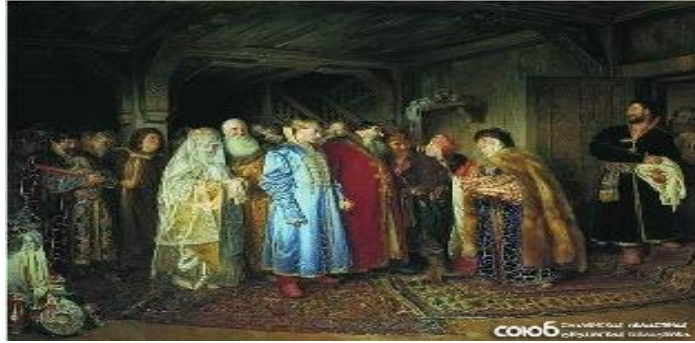
Fotoğraf 2: ‘Söz kesme’ ve ‘el vurma’ geleneğinden temsili bir görüntü

‘Daha sonra masaya oturulur, çay ve şarap içilir, hafif hafif atıştırılır’ (Kayyev, 1949, s.44). Türklerde bu tarz bir adet ve uygulama yoktur; ancak Türk toplumunda da hayır duanın gücüne olan inanç son derece büyüktür.