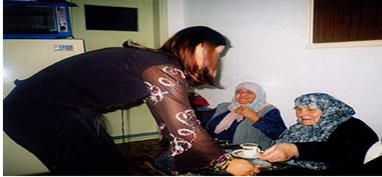
Fotoğraf 1: Türklerin kız isteme merasiminden temsili bir görüntü

Türk kültüründe kız istemeye gelenlere çeşitli yiyeceklerin yanında bir de Türk kahvesi ikram edilmektedir. Bazı bölgelerde gelin adayı damat adayının kahvesine şeker yerine tuz koyar; böylelikle damat adayının kendisini ne kadar çok sevdiğini ölçmüş olur. Yani damat adayı acı kahveyi içerse genç kız için her şeyi yapabileceği, hatta acı kahve bile içebileceği inancı vardır. Kahve içilip bittikten sonra erkek tarafı asıl mevzu, yani orada bulunma amaçları üzerine konuşmaya başlarlar. Dayanağı kutsalsa da halkın geleneksel tabiri olan ‘Allah’ın emri, peygamberin kavliyle kızınızı oğlumuz istiyoruz’ denilerek kız isteme merasimi başlatılmaktadır. Genellikle kızın ailesi hemen cevap vermez, düşünmek ve değerlendirmek amacı ile biraz zaman ister. Ruslarda da benzer bir geleneğin olduğu bilinmektedir. Eğer genç kızın ailesi bu düğüne razıysa, onlar açısından olumsuz bir durum yok ise, ebeveynler, ilk kız isteme merasimi sırasında cevap vermemelidirler. Bu durumda görüçülere, kızın anne ve babasını ikna etmek düşmektedir.