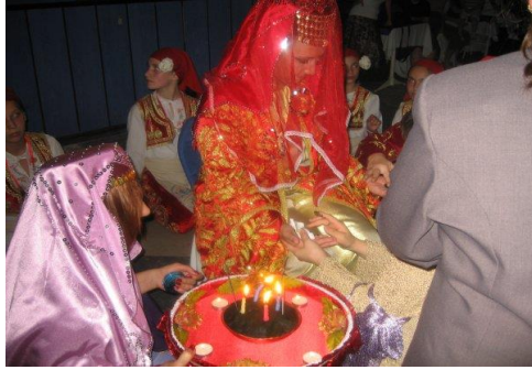
Şekil 4:

Ruslarda ise ‘bekârlığa veda’ Türklerden biraz farklıdır.