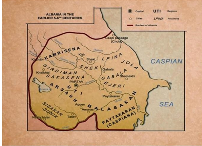
KAFKAS ALBANYASI DEVLETİNİN HARİTASI

Strabo'ya (MÖ. 64 - MS. 24) göre Albanya ( Alvanoí ), kuzeyde Sarmatiya ( Sarmatón ), 21 batıda İberiya ( Ivirian ), 22 güneybatıda Ermenistan'ın ( Ármenon ) bir kısım arazileri doğuda Hazar denizi ile sınırlandırılmıştır. 23 Aslında bu tanım birçok kimseye tanındık gelecektir. Zira bu sınırlar hemen hemen bugünkü Azerbaycan sınırlarıdır. Öyle ki bugün Azerbaycan, kimi İngilizce kaynaklarda Albanya yahut Kafkas Albanya'sı şeklinde geçmektedir. 24 Çeşitli nedenlerden dolayı, Kafkasya devletlerinin sınırları periyodik olarak değişmiştir. Alban toplumunun yaşadığı topraklar, Dağlık Karabağ ve Dağıstan'ın güneyi dâhil bugünün Azerbaycan topraklarıdır. Albanlar Kur nehrinin sağ ve sol kıyısında yaşıyorlardı. Strabo'un "Kur Nehri Albanya topraklarından geçiyor" 25 ifadesi bunu tasdik etmektedir. Genel olarak Albanya arazisi doğal sınırlar içerisinde 11 vilayete bölünerek yönetilmiştir. 26