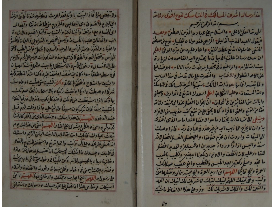
صورة الورقة الأولى من نسخة (و) مكتبة ولي الدين أفندي