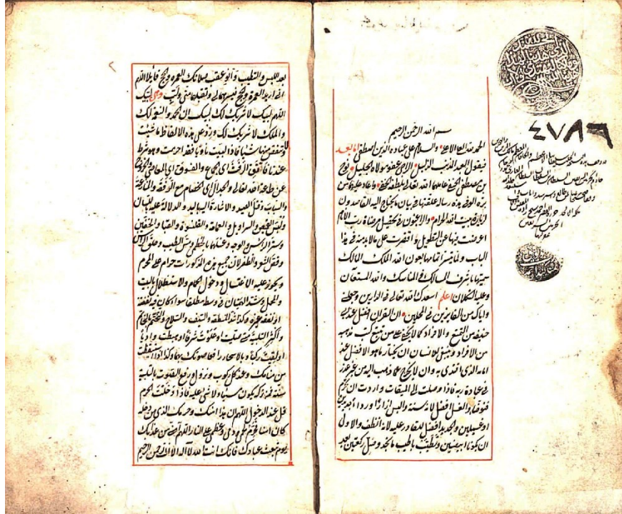
صورة الورقة الأولى من نسخة (ص) مكتبة أيا صوفيا