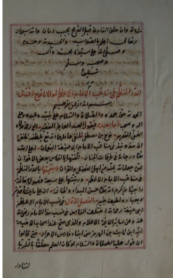
صورة الورقة الأخيرة من نسخة (و) مكتبة ولي الدين أفندي