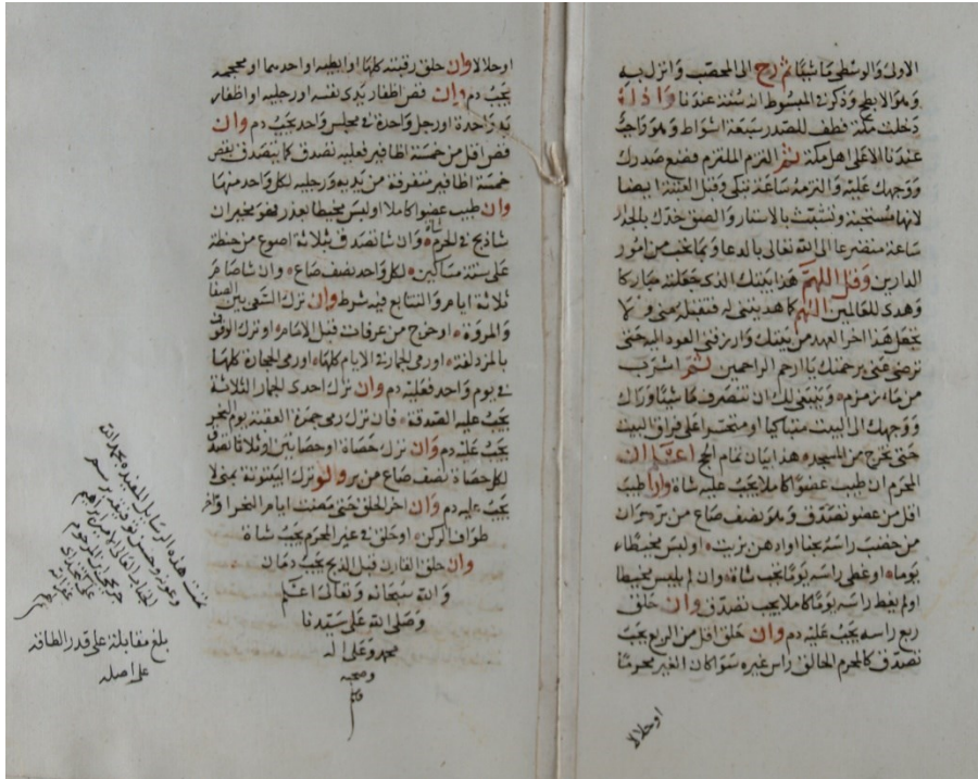
صورة الورقة الأخيرة من نسخة (أ) مكتبة ولي الدين أفندي