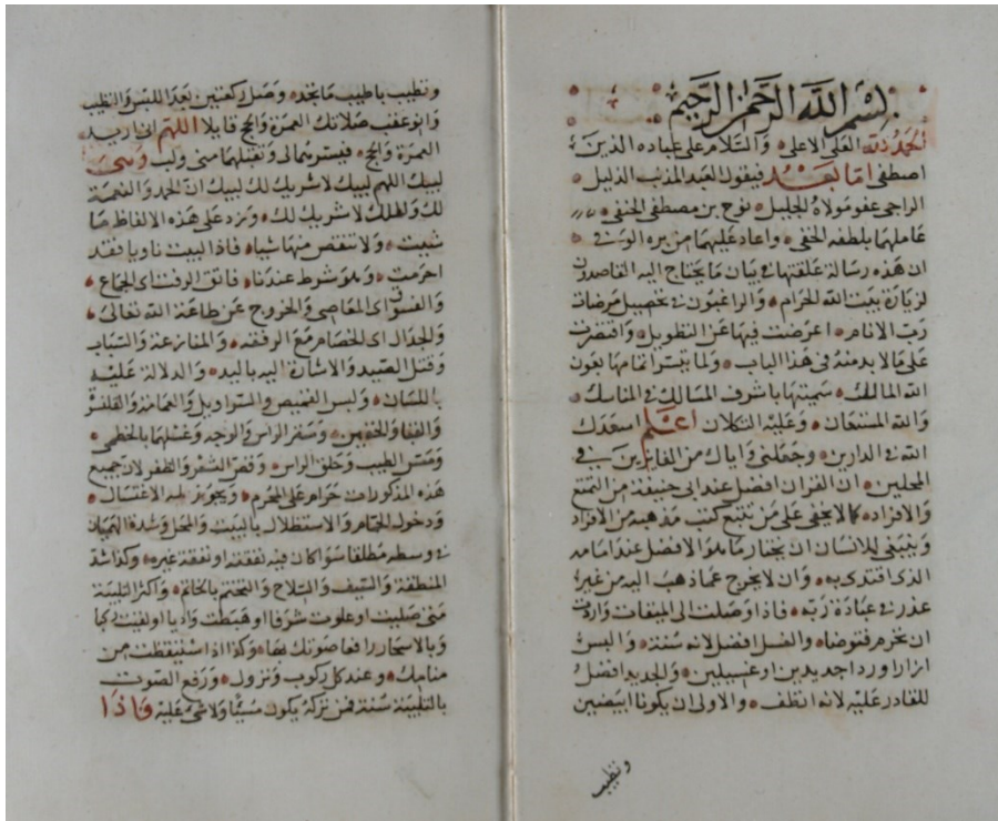
صورة الورقة الأولى من نسخة (أ) مكتبة ولي الدين أفندي