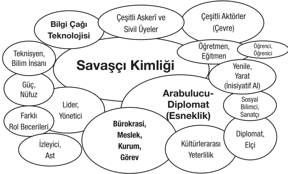
Şekil 2. Postmodern askerî kültür.

Bu proje, kültürün muğlak yanlarını, parçalanmışlığını ve tezatlarını yeterince hesaba katmayan geleneksel ve tekdüze kültür görüşlerinden (Geertz, 1973; Griswold, 1994; Schein, 2010) farklı olarak esnek ve pragmatik bir kurama ve avantajlı bir kültürel araç setine (Swidler, 1986, 2001) dayanıyor. Kültürel araçlar çağdaş askerî kültürün daha kapsamlı şekilde anlaşılabilmesini sağlıyor. Bu makale, kültür kavramını çokça tartışmalı bir araç seti olarak tanımlıyor. Bu araç setinin içinde yönelimler (orientations), araçlar, şemalar (bilişsel yapılar), çerçeveler, yasalar, anlatılar, alışkanlıklar, tarzlar, diller, semboller, değerler, inançlar ve varsayımlar mevcuttur. Tüm bunlar hep birlikte bir gruba, kuruma ya da topluma ortak bir anlam, kolektif bir kimlik ve eylem stratejileri sağlar (DiMaggio, 1997; Ender, 2009; Sewell, 1992; Swidler, 1986, 2001; Winslow, 2007). Elbette bu tanım, Swidler'in karşılıklı bağımlılık ve özerklik gibi zıt kültürel araçların dirsek teması içinde bulunmasına bir şekilde izin veren kültürel araçlar kavramının (Swidler, 2001) adapte edilebilir bir uygulamasıdır. Ayrıca kültürün bu şekilde kavramsallaştırılması Winslow'un (2007) bu iş için uygun olan askerî kültür kuramından da faydalaniyor. Bu kuram, entegrasyon, farklılaşma ve parçalanmayı bünyesinde barındırıyor. Bilhassa çağdaş savaşların ve silahlı kuvvetlerin parçalanmış doğası, postmodern askerî kültürün yükselişini destekliyor (Williams, 2008; Zalmon, 2006).