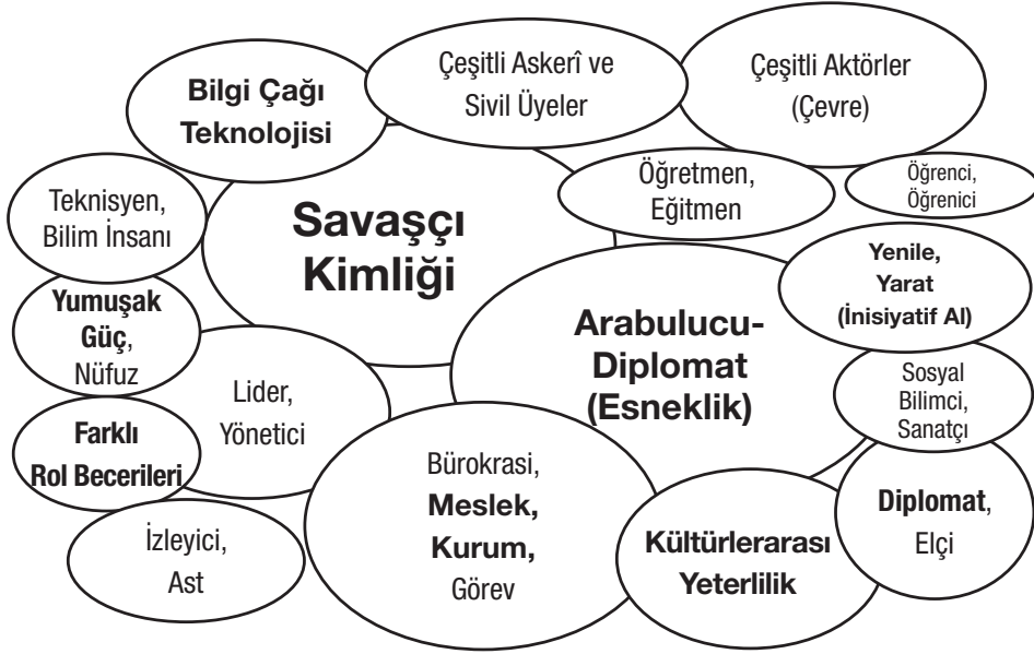
Şekil 4. Askerî danışmanların kültürel araç seti.