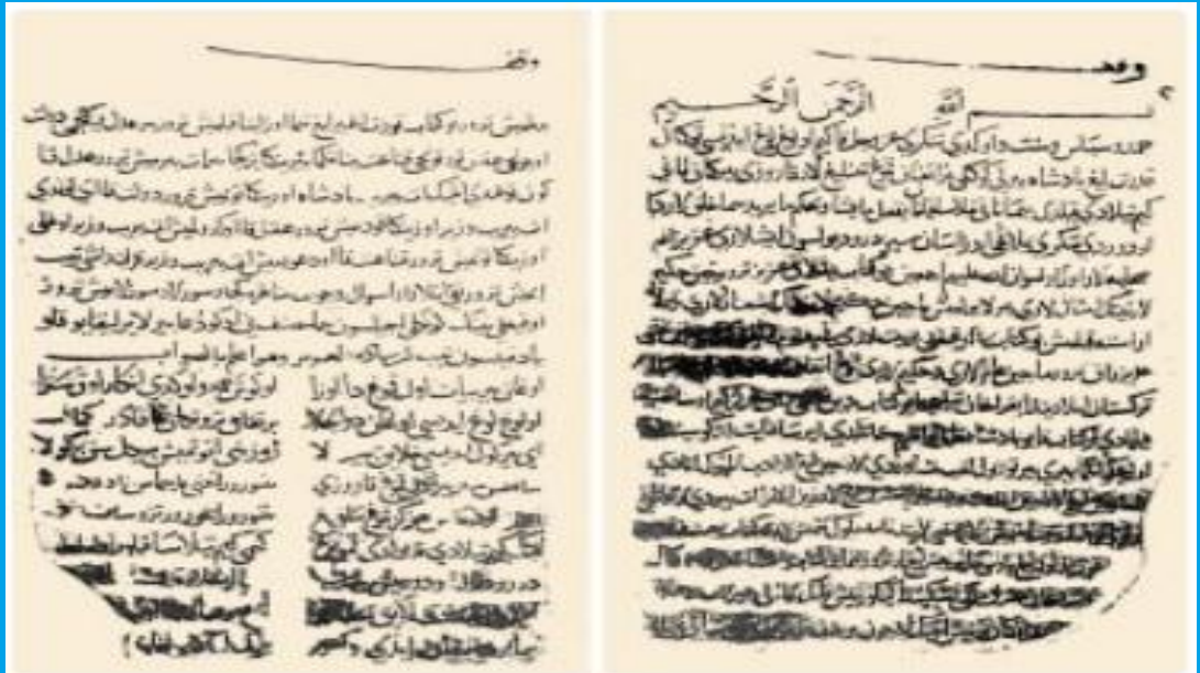
Kutadgu Bilig 'in Kahire nüshasının ilk iki sayfası (Mısır Millî Ktp., nr. 168)

Cilt/Volume Sayı/Number Yıl/Year 7 4 2020