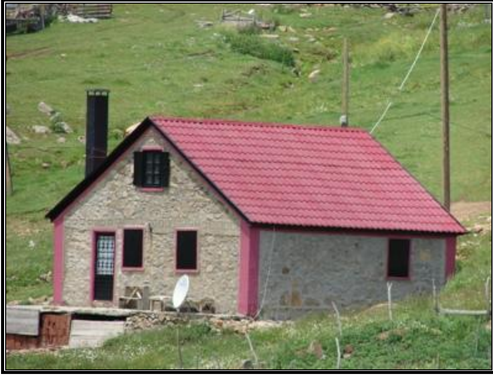
Fotoğraf 6. Çağdaş meskenler daha çok dinlenme amacıyla kullanılmaktadır.

Araştırma sahasındaki yaylalarda büyük oranda sığır besiciliği gelişmiştir. Bunun yanında küçükbaş hayvanlardan koyun yetiştiriciliği son derece sınırlıdır. Böyle olmakla birlikte sığır besiciliğinin de her geçen gün azaldığı, arazi gözlemleri ve mülakatlar neticesinde tespit edilmiştir. Nitekim geçmiş dönemlerde yaylacı ailelerin geçimlerini büyük ölçüde hayvan besiciliği ve çeşitli hayvansal ürünler oluşturmaktaydı. Günümüzde ise yaylacı ailelerin ortalama 3-5 büyükbaş hayvan besledikleri dikkati çekmektedir. Bütün bunlar yörede hayvancılık eksenli geleneksel yaylacılık faaliyetinin büyük ölçüde önemini yitirdiğini göstermektedir. Az sayıdaki aile, kısmen kendi ihtiyaçları için hayvancılık ekonomisini sürdürmekle birlikte ticarî amaçlı hayvancılık neredeyse ortadan kalkmıştır. Hayvancılıkla uğraşan yaylacılar için kışlık kuru çayır üretimi önemli bir ekonomik faaliyettir. Doğu Karadeniz kıyı kuşağının hemen bütünüyle tarımsal alanlara dönüştürülmüş olması, çayır üretimi açısından yaylaları ön plâna çıkarmıştır. Bunun dışında yayla meskenlerinin yakınında karalâhana, patates, marul ve yeşil soğan gibi tarımsal üretim de yapılmaktadır. Ancak bu faaliyetin ticari bir boyut taşımayacak kadar sınırlı olduğunu belirtmek gerekir.