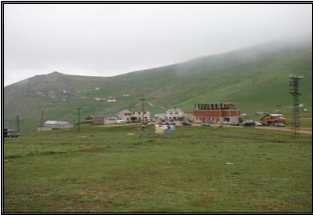
Fotoęraf 7. Yayla turizm merkezi konumundaki Cami Boęazı yaylasından bir görünümler.

Genellikle Trabzon'a baęlı Yomra ve Maka ilçelerinde oturan nüfusun yararlandıęı Kurtdere yaylası, Cami boęazına yaklaşık 5.5 km ve Çakırgöl'e ise 5 km uzaklıktadır. Burada 2300 m yükseltideki 50 yatak kapasiteli Dilaver Yayla Tesisleri turizme hizmet etmektedir. Sadece yaz mevsiminde hizmet veren tesiste 10 personel istihdam edilmektedir. Özellikle yerli turistlerin uğrak noktası olan tesiste ortalama konaklama süresi 2-3 gun kadardır.