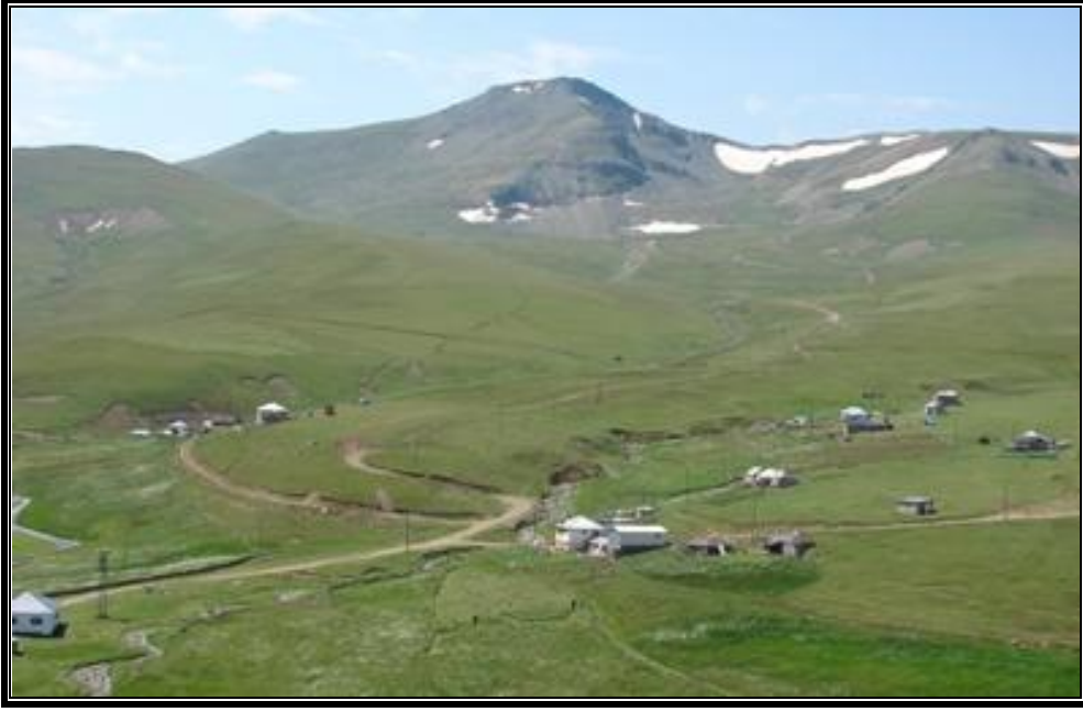
Fotoğraf 2. Karahava yaylası aşınım düzlükleri üzerinde kurulmuştur.

Doğu Karadeniz tektonik kuşağı içerisinde bulunan Çakırgöl ve yakın çevresinde Mesozoik yaşlı Mescitli Formasyonu (kumtaşı, killi kireçtaşı, marn, şeyl, tuf), Çatak Formasyonu (bazalt, andezit ve piroklastikleri, kumtaşı, killi kireçtaşı), Çağlayan Formasyonu (bazalt, andezit ve piroklastikleri) ve Tersiyer yaşlı Kaçkar Granodiyoriti ile Kabaköy Formasyonu (andezit, bazalt ve piroklastikleri, kumtaşı, kumlu kireçtaşı, tuf) yüzeylenmektedir (M.T.A., 1/100 000 ölçekli Türkiye Jeoloji Haritası Trabzon E 29 paftası).