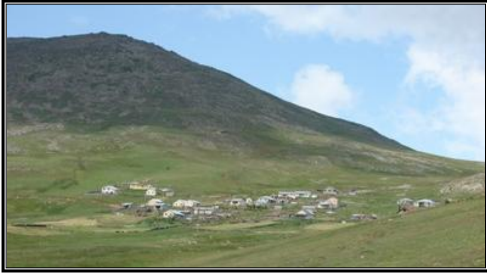
Fotoğraf 4. Güney yamaçlar ile rüzgâra karşı korunaklı sahaların tercih edildiği Kasaboğlu yaylasından bir görünüm.

Çakırgöl çevresindeki yaylaların kuruluş yerlerinin seçilmesinde coğrafi faktörlerin farklı ölçeklerde rol oynadıkları görülmektedir. Bunların başında yaylalarının büyük bir çoğunluğunun daha fazla güneş alan güney yamaçları tercih etmiş olmaları gelir. Böyle bir tercihte sıcaklık koşullarının daha elverişli olmasına bağlı olarak kar örtüsünün erken erimesi ve otların daha erken yeşermesi temel etken durumundadır. Yaylaların genel olarak eğimli ve kuytu yamaçları kuruluş yeri olarak seçmelerinde, soğuk rüzgârlardan korunma isteği de etkili olmuştur (Fotoğraf 4). Çünkü yüksek ve açık sahalar olan dağlar üzerinde rüzgârın şiddeti fazladır. Bu nedenle geleneksel yaylacılığın sürdürüldüğü ve basit bir şekilde yapılmış meskenlerin şiddetli rüzgârlardan etkilenmeleri söz konusudur. Nitekim mesken çatılarının rüzgâr nedeniyle uçmasını engellemek amacıyla, çatıların taş malzeme kullanılarak sağlamlaştırıldığı da görülmüştür. Aynı şekilde hayvan barınaklarının da dolu, rüzgâr, yağmur gibi iklim elemanlarının olumsuz etkilerinden korunabilecekleri en uygun konumları dulda yamaçlar oluşturur.