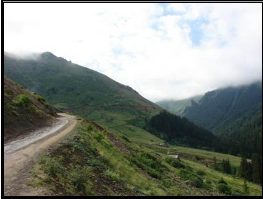
Fotoğraf 1. Cami Boğazı yaylasına ulaşan karayolundan bir görünüm.