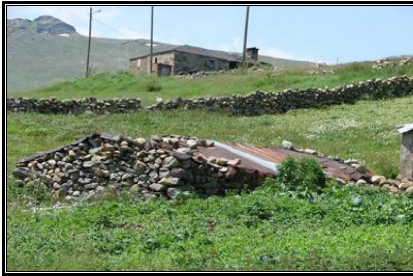
Fotoğraf 5. Geleneksel yayla evleri olan keliflerden bir görünüm.

Ancak son yıllarda yayla konutlarında önemli bir dönüşümün yaşandığı ve geleneksel yayla konutları olan keliflerin sayısının hızla azaldığı dikkati çekmektedir. Bu nedenle ikametgâh olarak kullanılan kelifler hemen hemen ortadan kalkmıştır. Bunda sosyo-ekonomik değişim, ulaşım ağı ve araçlarının gelişmesi gibi faktörler etkili olmuştur. Bunun yanında refah seviyesinin de yükselmesi, çağdaş yapı gereçlerinin kullanılarak kıyı kuşağındakilere benzeyen ve çoğunlukla doğal ortamla uyumsuz meskenlerin yapılmasına zemin hazırlamıştır (Fotoğraf 6). Bu meskenler ya altı ahır üstü ikametgâh olmak üzere iki katlı ya da tek katlı ve hemen yanında hayvan barınağı şeklinde yapılmaktadır. Yayla meskenlerinde çatı örtü gereci olarak çinko kullanılmakta ve kışın bol kar yağması nedeniyle çatılar eğimli yapılmaktadır. İklim özellikleri nedeniyle, çatı örtü gereci olarak kiremit çok nadir kullanılmıştır.