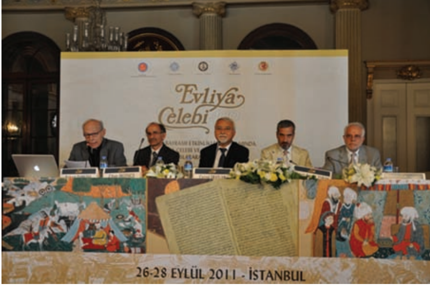
Uluslararası Evliya Çelebi ve Seyahatname'si Toplantısından bir kare