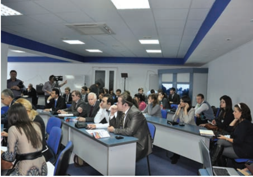
Türk-Rus İlişkileri IV. Çalıştayından bir kare