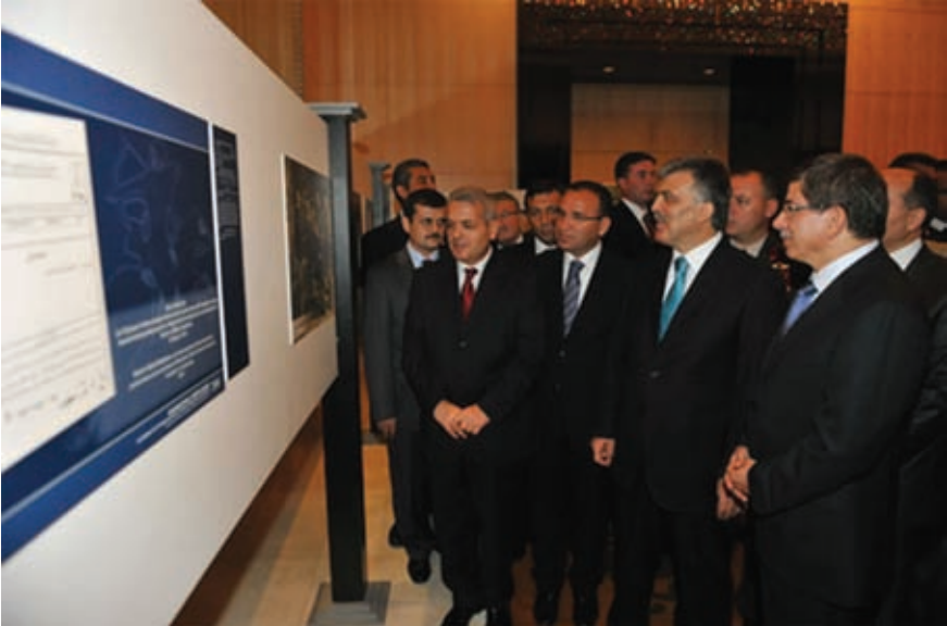
Cumhurbaşkanı Gül ve beraberindekiler, Bağımsızlıklarının 20. Yılında Türk Cumhuriyetleri toplantısında "Belgelerle Osmanlı-Türkistan İlişkileri" sergisini gezerken