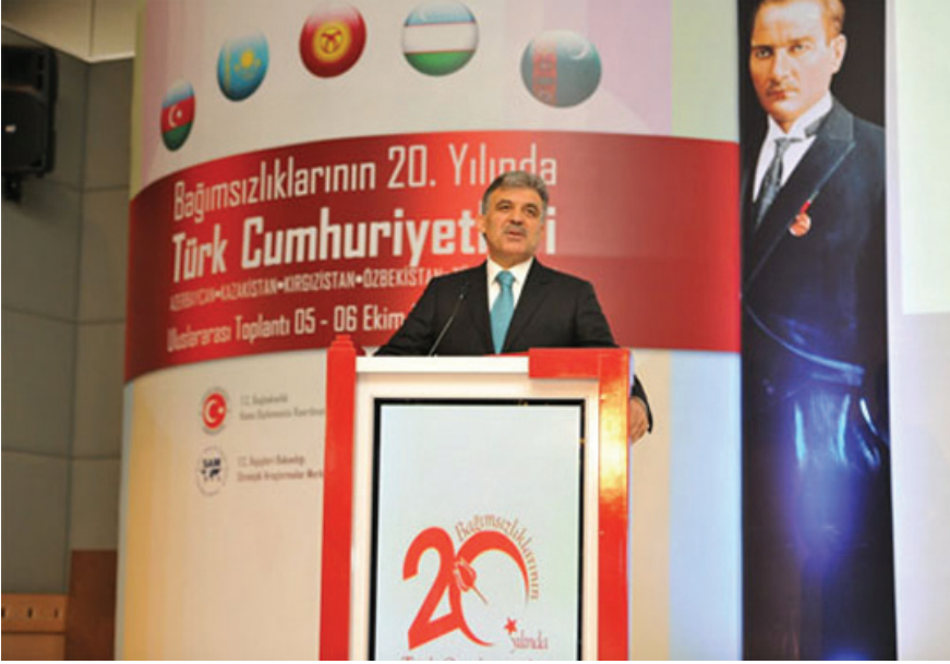
Cumhurbaşkanı Abdullah Gül, Bağımsızlıklarının 20. Yılında Türk Cumhuriyetleri toplantısı açılış töreninde konuşmalarını sunarlar