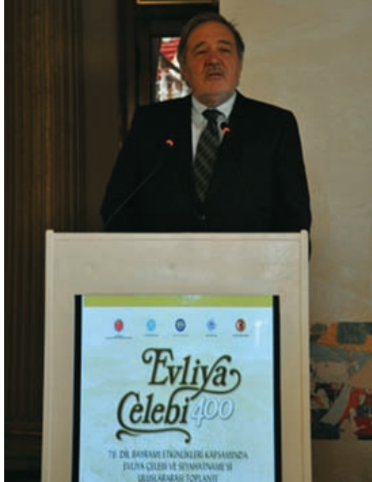
Prof. Dr. İlber Ortaylı, Açılış konuşmalarını sunarken