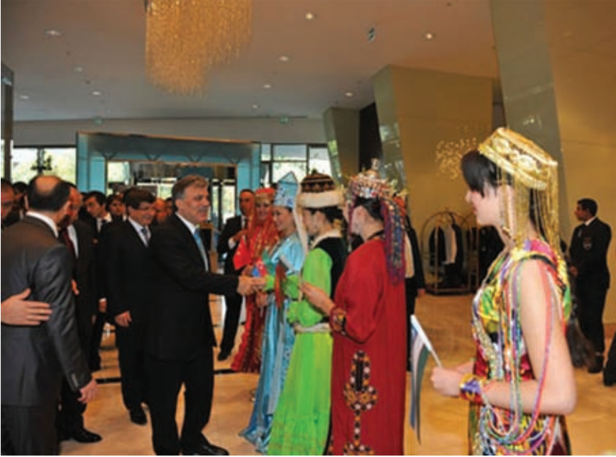
Cumhurbaşkanı Abdullah Gül, kendisini karşılayan Türk cumhuriyetlerinin geleneksel giysilerini giymiş genç kızlarıyla birlikte