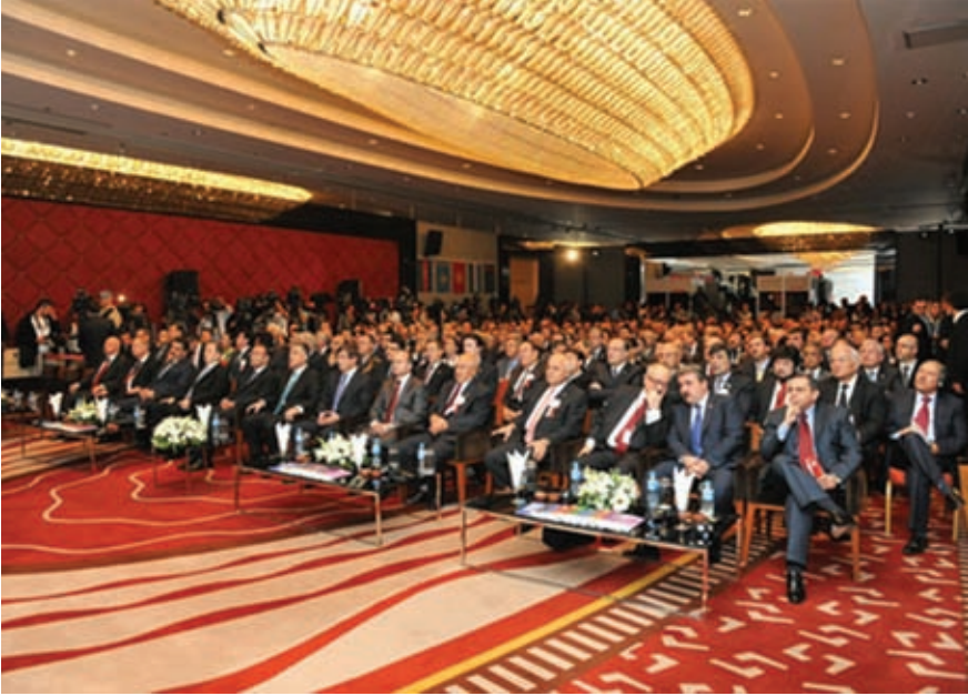
Bağımsızlıklarının 20. Yılında Türk Cumhuriyetleri toplantısı açılış töreninden bir kare