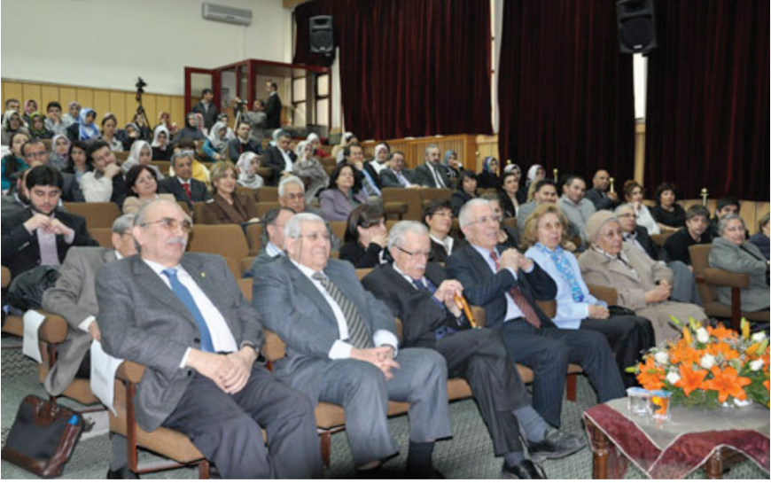
Saygı Paneline katılanlar bir arada