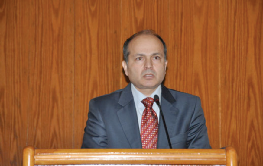
Merkezimiz Başkanı Horata, açış konuşmalarını sunarlarken