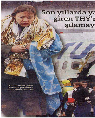
(Hürriyet, 26 Şubat 2009) "Kurtulan bir yolcu kazanın şokundan uzun süre kurtulamadı"

Bunun yanı sıra 26 Şubat tarihli Hürriyet Gazetesi ile yine aynı tarihli De Telegraaf gazetesinde aynı haber ajansından geldiği tahmin edilen bir fotoğraf yer almaktadır. Fakat haberin dikkat çekici kısmı Hürriyet gazetesinde yürüyen hafif yaralı kadın yalnızken, De Telegraaf gazetesinde kazazedenin yanında bir de polis memuru görünmektedir. Bu durumda gazetelerden birinde fotoğraf karesinden ya özellikle polis memuru çıkarılmış, ya da özellikle eklenmiştir.