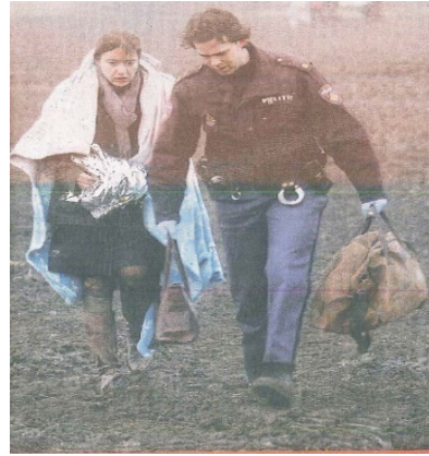
(De Telegraaf, 26 Şubat 2009) Bütün enkazın ve çamurun arasında hafif yaralı bir yolcu, eşyalarını taşıyan bir polis memuru ile ilk yardımın gerçekleştiği