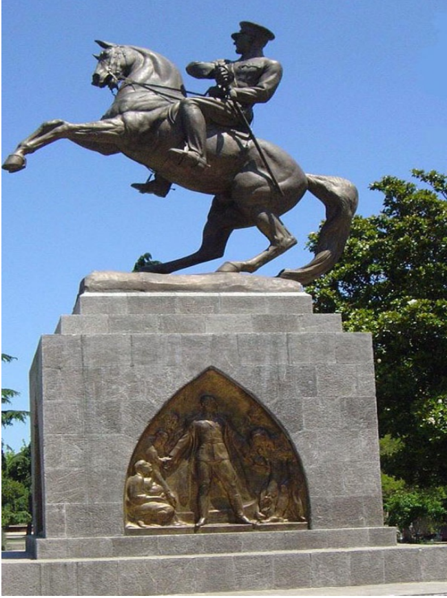
Resim 3. Atatürk'ün Samsundaki atalı heykel (Yazarın koleksiyonundan).

İstanbul halkına, benim ilk heykelimi dikerek ifade ettikleri yüksek takdirleri ve asil hisleri münasebetiyle en samimi şükranlarımı sunarım.