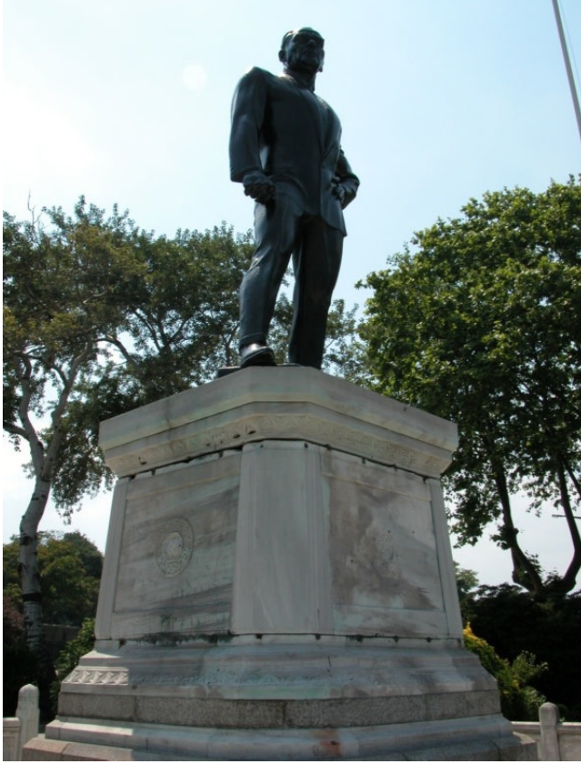
Resim 2. Atatürk’ün ilk gerçek boyuttaki heykeli.

ulusun egemenliđi anlatılmaktadır. Heykeldeki kararlı duruş, “ayakta durabilme” sözcüğünü somutlaştırmaktadır. Son olarak, heykeldeki Atatürk, bir “takım elbise” giymektedir. “uygar” ya da “uygarlaştırıcı” bu giysi yeni bir insan olgusunu simgelemekte olup aynı zamanda maddede belirtilen “medeniyet” sözcüğüne atıftır. Sanatçı Samih Tiryakiođlu’nun yorumuyla bu heykel Atatürk’ün kendi düşüncelerini ortaya koymakta, “her türlü askeri ve sivil rütbeden soyunarak sine-i millete dönme”, Anadolu’ya gitme ve düşmanla savaşıma kararlılığını ortaya koymaktadır.(67)