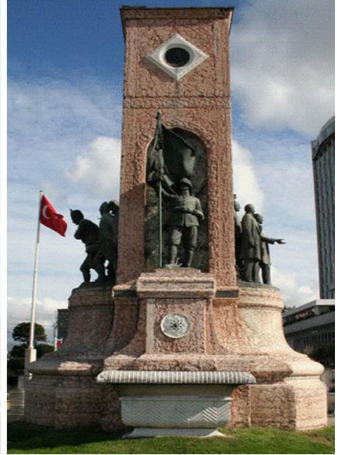
Resim 10. Taksim Cumhuriyet Anıtı. Üst sol cumhuriyetin doğuşunu, üst sağ Kurtuluş Savaşını temsil etmektedir.