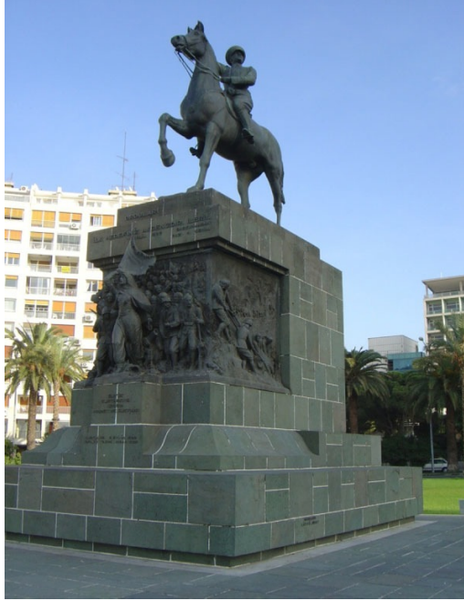
Resim 9. Atatürk'ün İzmir'deki anıtı

üzerindeki otoritesini göstermektedir. Ulusu, Atatürk'ün önderliği altında tek bir ülke olarak betimlemektedir.