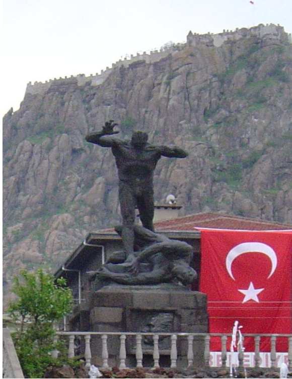
Resim 5. Afyon'daki Zafet Anıtı

Krippel'in rejim için yaptığı son önemli anıt, 1936 yılında Afyon'da dikilen "Zafer Anıtı"dır. 1922 Ağustos'unda Büyük Taarruz'un başladığı şehirdir Afyon. (Bkz. Figür 5) Türk sanatçısı Sadi Barak, Atatürk'ün, anıtın çevresindeki rölyeflerin konularını bizzat seçtiğini anlatır. Atatürk tarafından yurt dışına film yapımıcılığı eğitimi için gönderilen gazeteci ve yazar Münir Hayri Egeli, Krippel'in bir toplantıda Atatürk'e anıtın planlarını anlattığını ve Atatürk'ün, rölyeflerin kavramsal sunumunu değiştirdiğini söyler.(74)