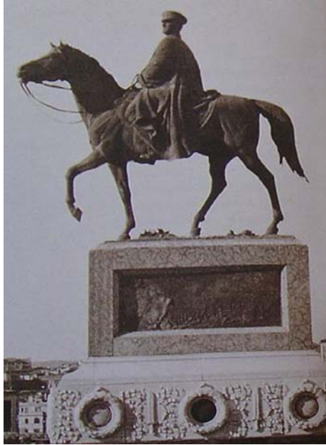
Resim 7. Etnografya Müzesi önündeki Atatürk'ün atlı heykeli (Kaynak Burcak Evren, 1998).

Henüz Gazi'yi görmedim. Ama bugün o fatihin kafasını ve güçlü gözlerini gördüm. Gazi'ydi. Roma'dayken Bay Mussolini beni ofisinde kabul etti. "Türkiye'ye büyük bir adamın heykelini yapmaya gidiyorsunuz" dedi. "Size başarılar diliyorum. Bu şeref yalnızca size değil, tüm İtalya'ya aittir. Umarım ki, bu olay Türk İtalyan ilişkilerine dürüstlük getiren önemli bir faktör olur.(78)