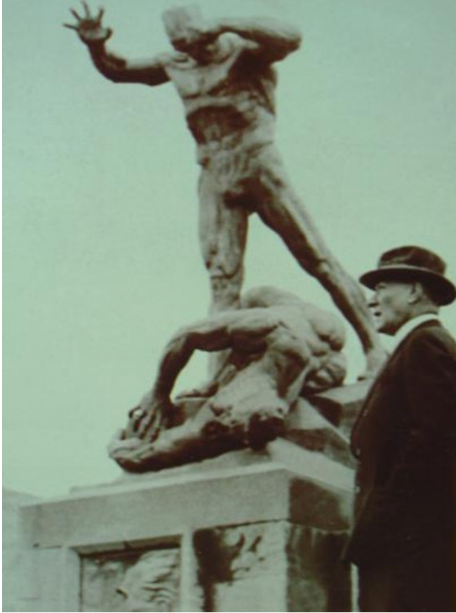
Resim 6. Afyon'daki Zafer Anıtı'nın bir fotoğrafı. 1937 yılında Atatürk'ün şehri ziyaretinde çekilmiştir. Ayaktaki figürün erkeklik organı 1954'te küçültülmüştür.

Zafer Anıtı, tüm figürlerin tamamen çıplak olması nedeniyle erken cumhuriyet döneminin en belirgin anıtı olmuştur. (Bkz. Figür 6) Ana figür, Atatürk'ü andırmakla birlikte çok açık bir benzerlik olmaması nedeniyle yerel ve ulusal basının özellikle, Atatürk heykeli diye adlandırmadığı bir anıttır. Heykelin sıkılı sol yumruğuyla, çok kararlı bir duruşu vardır. Sağ eli bir kartal pençesi gibi kıvrılmış, vurmaya hazır beklemektedir. Bugün heykelin resmi tanımı, "Bir Türk erkeği figürü"dür.(75) Figür, çıplaklığından doğan eril bir önder otoritesi taşıyan bir biçimde yontulmuştur. Sözcük anlamında ve figüratif olarak çıplak olmasına karşın ulusun güçlü bedenini betimlemektedir. Onun güçlü erkekliğinin altında düşman acılar içinde yatmaktadır. Ayaklar altındaki yenilmiş adamın yüzü bir Roma heykelini anımsatmaktadır. Sadece çıplak değil, aynı zamanda savunmasızdır da. Bu duruş, savaşı kaybeden Yunan ordusunu simgelemektedir.