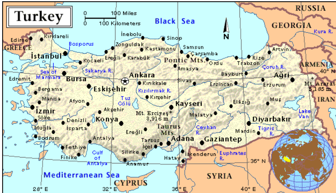
Figure 1. Map of Turkey