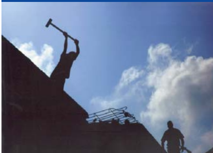
Kapak Fotoğrafı "Yıkımcılar" Feyyaz Çetinel TTB-STED Fotoğraf Yarışması 2008 Sergi Ödülü

1967 Balıkesir doğumluyum. Fotoğrafla 2000'li yılların başında ilgilenmeye başladım. Yurt içinde ve yurt dışında bir çok sergiye katıldım. Basaf (Balıkesir Fotoğraf Sanatı Derneği) üyesi olup bu dernekte uzun yıllar fotoğraf eğitimi verdim. Fotoğrafta daha çok estetik ağırlıklı belgesel çekim tarzını tercih ederim. Bu amaçla doğu ülkelerine solo ağırlıklı çekim gezilerine gidip sergiler açtım. Hindistan Büyükelçiliği'nin ilk davetli fotoğraf sergisini gerçekleştirdim. Halen Serbest eczacı olarak çalışıyorum.