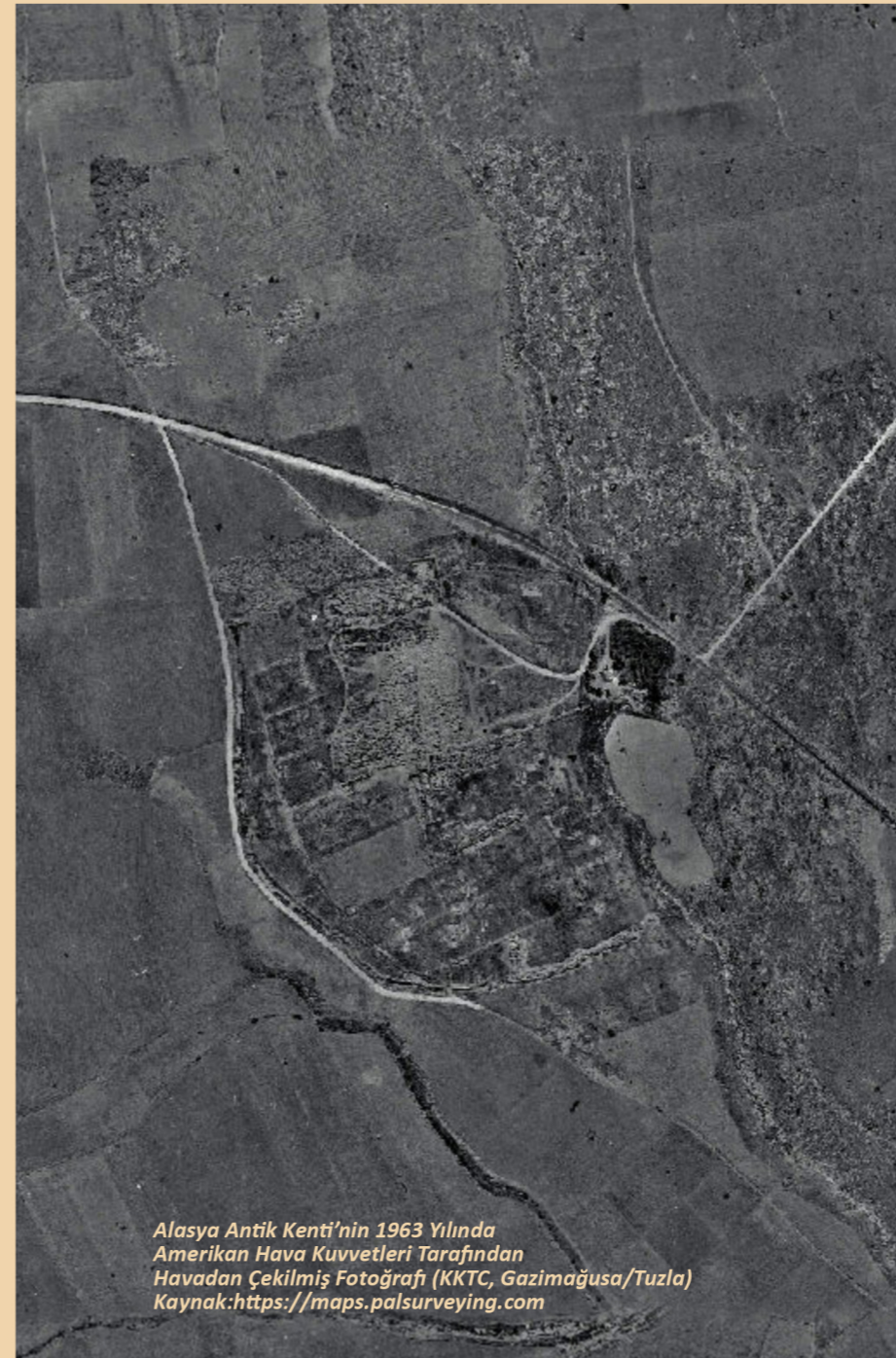
Alasya Antik Kenti'nin 1963 Yılında Amerikan Hava Kuvvetleri Tarafından Havadan Çekilmiş Fotoğrafı (KKTC, Gazimağusa/Tuzla) Kaynak: https://maps.palsurveying.com

Posta Adresi: Haspolat Kavşağı Yanı, PK, 717 Haspolat - Lefkoşa - Kuzey Kıbrıs Mersin 10, Türkiye