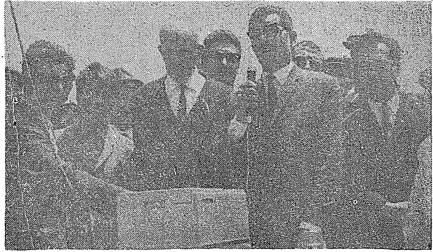
Ekibimiz Kars İmam - Hatip okulunun temel atma merasiminde

Gidilen her yerde Müslüman halkımızın büyük teveccühüne mazhar olan ve kürsülerden yaşlı gözlerle dinlenen ekiplelerimiz, tekrar dönmek üzere duvarlarla uğurlanmışlardır.