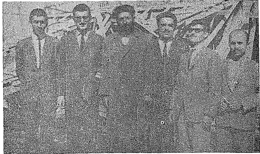
Arkadaşlarımız Erzurum İslâm sitesini geziyorlar.