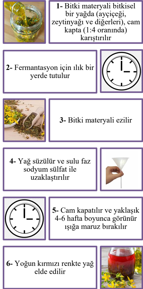
Figür 1. Hypericum yağının hazırlanması.

Son yıllarda sarı kantaron içeren bitkisel ilaçların dahilen (oral yoldan) ve haricen (tentür, yağ vb.) kullanımı dramatik bir şekilde artmıştır, öyle ki en çok tüketilen bitkisel preparat olmuştur (Coppock ve Dziwenka, 2021). Bitkinin halk arasındaki kullanımı sıklıkla; haricen yara ve yanıkların tedavisi, dahilen ise depresyon tedavisi şeklindedir. En yaygın kullanılan topikal preparat, taze veya kuru çiçekler veya bitkinin çiçekli toprak üstü kısımlarından yapılan hypericum yağıdır. Hypericum yağının hazırlanması Şekil 1'de gösterilmiştir. Bu işlemler sonucu elde edilen ürünün stabilitesi sınırlı olduğu için kahverengi cam şişelerde muhafaza edilmesi gerekir. Işığa kısa süre maruz bırakmak protohiperisini hiperisine dönüştürürken, maruziyet birkaç hafta sürdüğünde hiperisin diğer ürünlere indirgenir ve yağda çok düşük konsantrasyonlarda bulunur. Hazırlanmış yağın yakut kırmızısı rengi, hiperisinin lipofilik parçalanma ürünlerinden