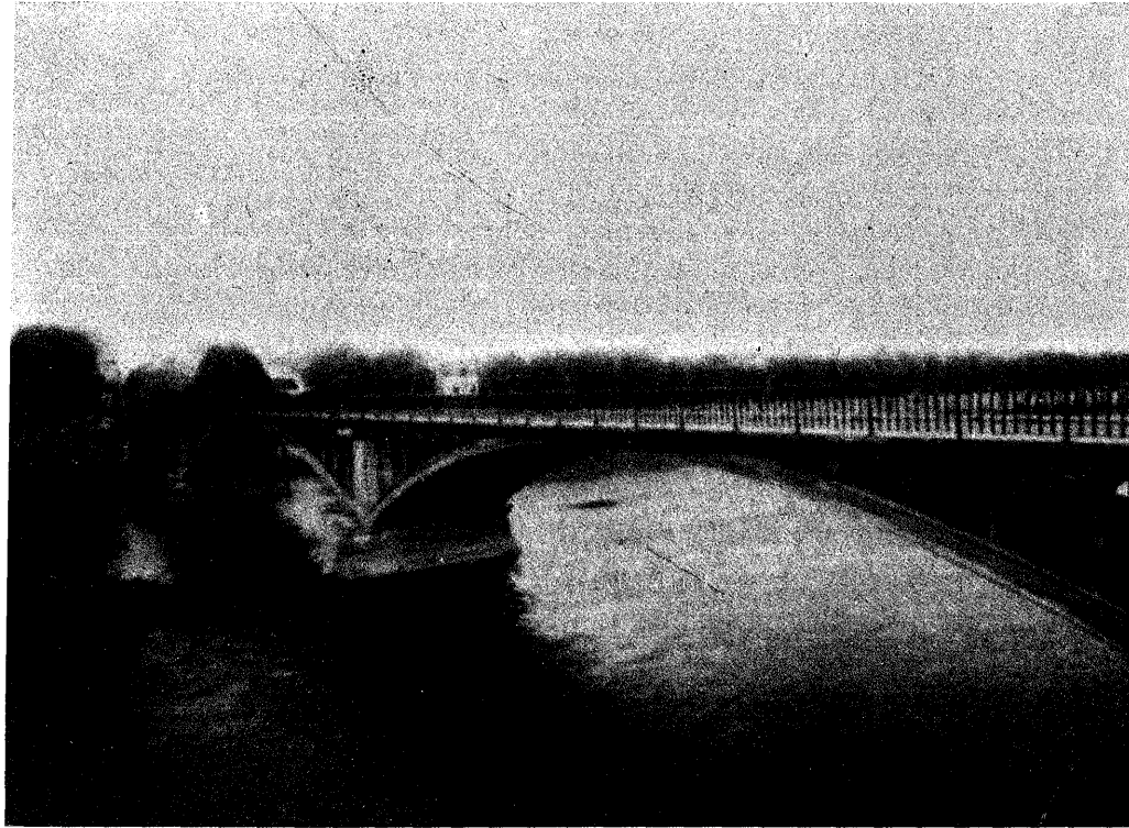
Resim 3: Iron Köprüsü, A.Darby, 1779 (Billington, 1983: 29)

Fransız, İsveç ve Alman ekolleri arasındaki mücadele başlar ve Alman ekolünün galibiyeti ile sonuçlanır. Soyut matematiksel bilginin probleme özel kullanımı ile, bilginin belirli tabakaların –sistemlerin– tasarımı amacı ile tekrar tekrar kullanılmak üzere yöntemleşmesi aynı şey değildir (Resim 4). D.P.Billington'a göre (1983: 153, 161), 1904'de Fransız ekolünün başını çeken F.Hennebique'in bir köprüsünün yapım sırasında yıkılması ve İsveç ekolünden W. Ritter'in 1906'da ölümü nedeni ile Alman ekolü galip gelebilmiştir. Oysa, bunların hiç biri de olmamış olsa, şekillenmekte olan ekonomik düzen ve üretim ilişkileri bu savaşın sonunu zaten belirlemiştir. Talep, Alman ekolünün ürettiği, hızlı üretim seferberliğini sağlayacak, evrensel olan ve hiyerarşik üretim ilişkilerine uygun olan türden bir bilgiyedir. Alman ekolü ile