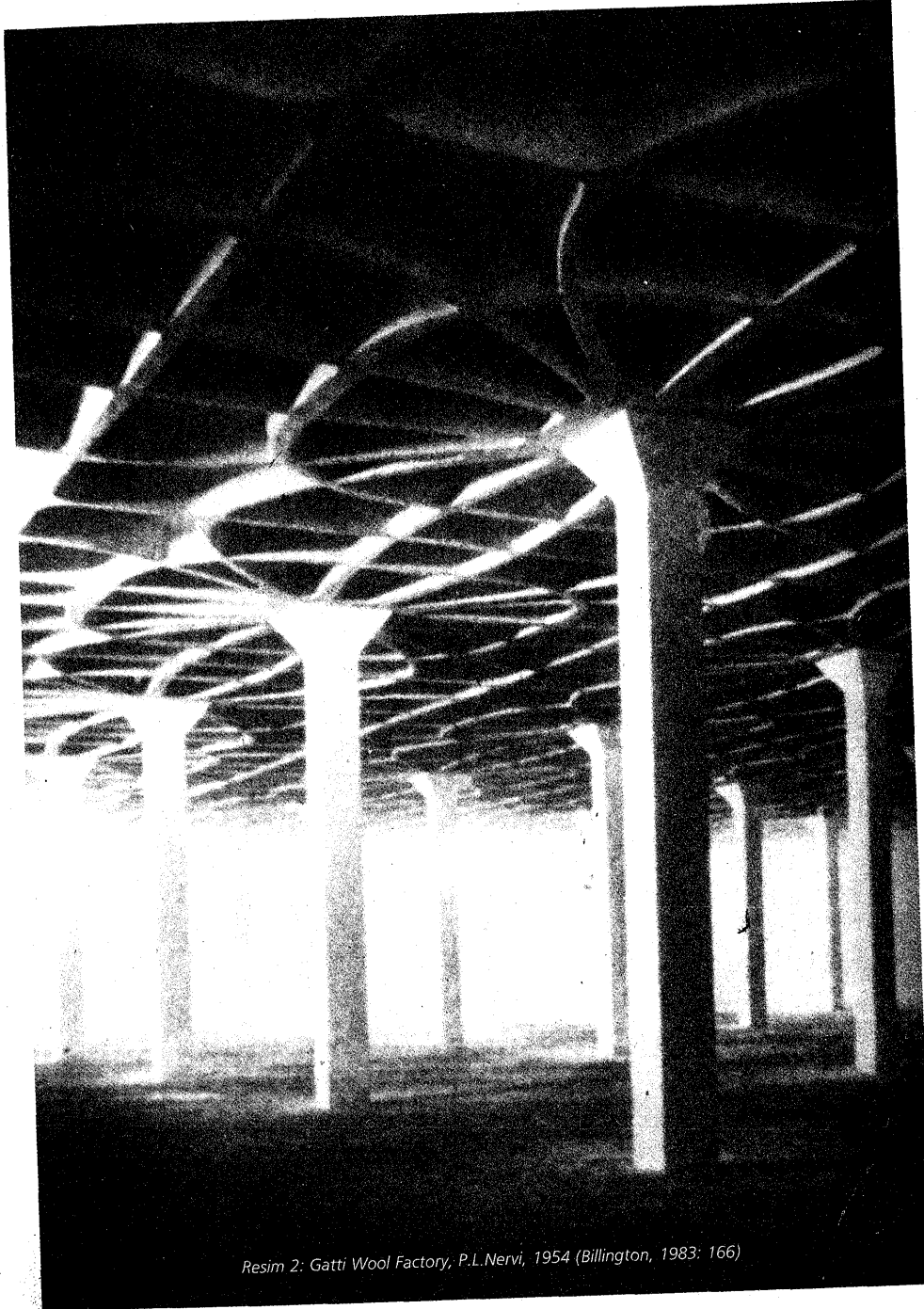
Resim 2. Gatti Wool Factory, P.L.Nervi, 1954 (Billington, 1983: 166)

ğunluğu, "üretim biçimi"ni değil, sadece "ürün biçimi"ni tasarlayabilirler. Her türlü biçim tasarlanabilir olduğundan, hala geçerli olmasına rağmen "biçim formülü izler" sloganı unutulmaya yüz tutar. Yaratıcılık, biçimsel farklılığın tasarımı haline gelerek ucuzlar. Ancak geleneğin aksine, bina güvenliğinin teknikler tarafından garantiye alındığı bu ortamda tasarımcı üzerindeki toplumsal baskı ortadan kalkmıştır. Bir kez teknolojiyi seçtikten sonra, o teknoloji ile tasarlanabilecek sonsuz sayıda biçimin olabilirliği, yeni bir gelenek haline gelmiş olan tekniğin hızlı ve güvenli ellerine terk edilmiştir. Örneğin, çerçeve sistem kullanarak sonsuz biçimlenme olanakları elde edebilirsiniz. Ama bunların hepsinin de matematiksel analiz ve tasarımı, aynı yöntemler tekrar tekrar kullanılarak yapılır. Sistem binadan soyutlanır, yöntem uyarınca modellenir ve analiz-tasarımı yapılır. Böylece, tıpkı diğer sistemler gibi taşıyıcı sistem de bina bütünlüğünden ayrılabilir bir "tabaka" oluşturur. Bu tabakalar (taşıyıcı, konstrüksiyon, ince yapı, mekanik, elektrik sistemleri) modüler koordinasyonla birbirlerine uyarlanırlar. Bu tabakaların çoğu "deneyim ötesi matematik" kullanılarak tasarlandığından, içerdikleri bilgi duyular aracılığı ile deneyimlenebilir değildir. Sözkonusu deneyim ne mimar tarafından, ne de sade vatandaş tarafından gerçekleştirilebilir.